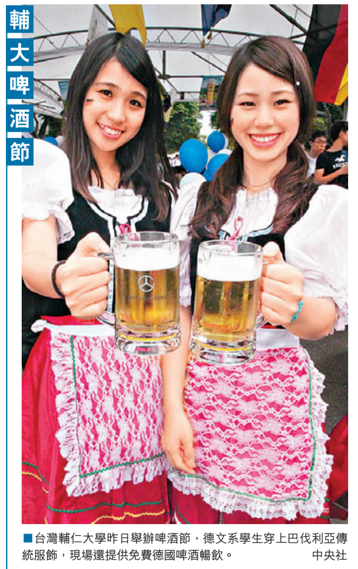
台灣輔仁大學昨日舉辦啤酒節，德文系學生穿上巴伐利亞傳統服飾，現場還提供免費德國啤酒暢飲。

經濟坐困愁城 蕭萬長籲「加值」 據中通社電 面對台灣經濟發展陷入低迷，甚至要為經濟增長率「保一」而奮戰，有「台灣經濟老兵」之稱的蕭萬長昨日表示，他參與見證台灣經濟發展半世紀，沒見過社會如此充斥無力與茫然，顯示台灣經濟正陷入坐困愁城的變局當中。他建議台灣應將自己定位成「加值島」，成為亞太地區的加值服務中心，建立屬於自己特色的發展模式。 對於台灣未來的定位和方向，蕭萬長認為，台灣應該朝「加值島」努力，變成亞太地區的加值服務中心，其他國家到台灣可以增加附加價值。在總體經濟方面，應該在生產、生活、生態「三生」上下功夫，透過創新提高價值；就個人來說，則是要「幸福加值」，讓台灣成為幸福的加值島。 他強調，台灣還是有優勢，在教育、人才、政策上，目前都朝着開放的角度與世界接軌的方向做。蕭萬長呼籲大家不要太悲觀，並希望各界再給馬團隊一點時間。