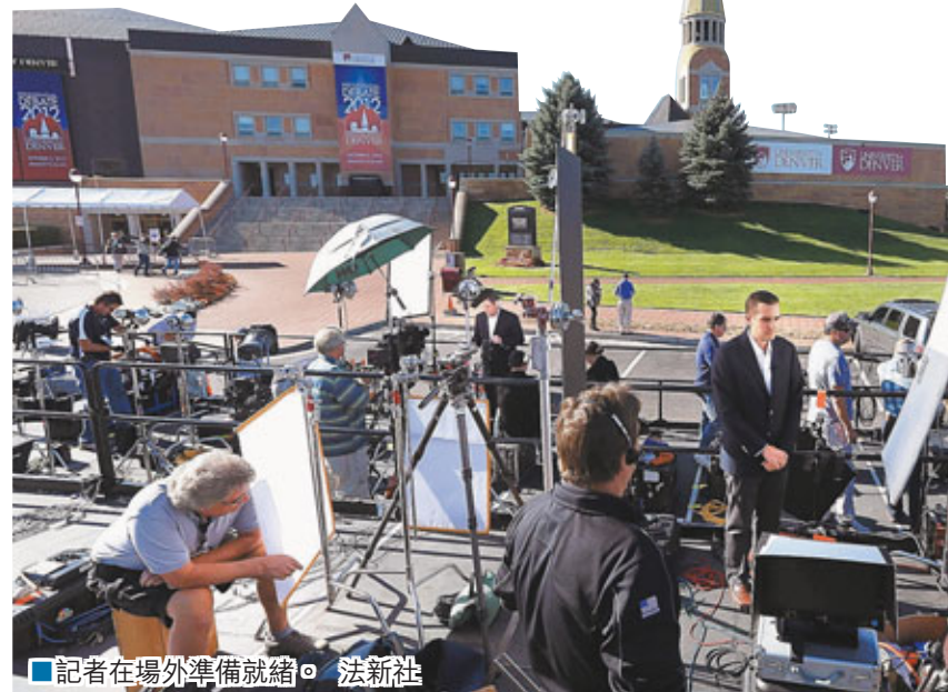
記者在場外準備就緒。