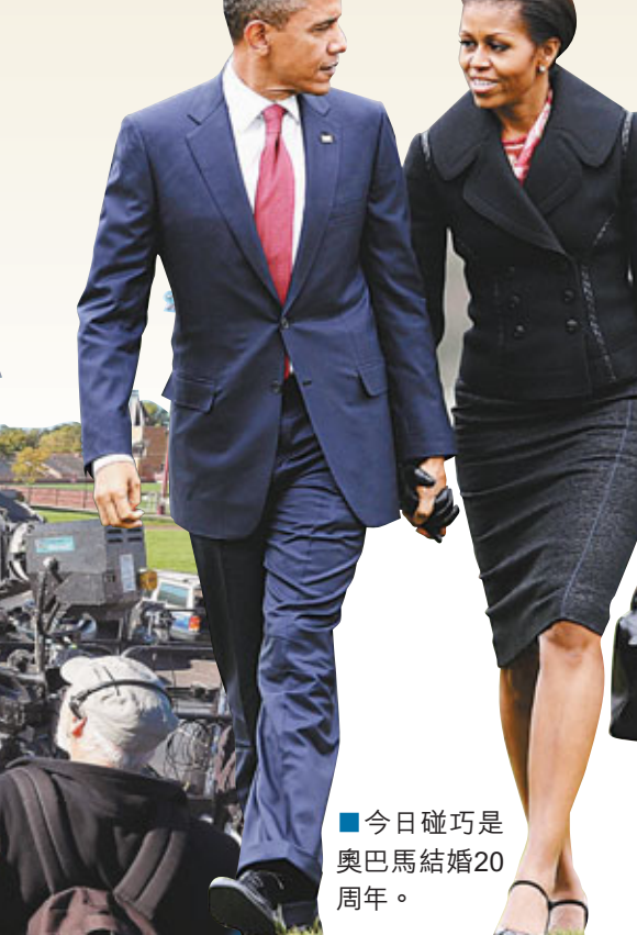
今日碰巧是奧巴馬結婚20周年。