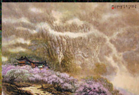
姜振國作品《三月桃李盡芳菲》

時間：即日起至10月31日 上午11時至晚上7時 地點：加華藝廊（上環四方街23號） 查詢：2803 2669