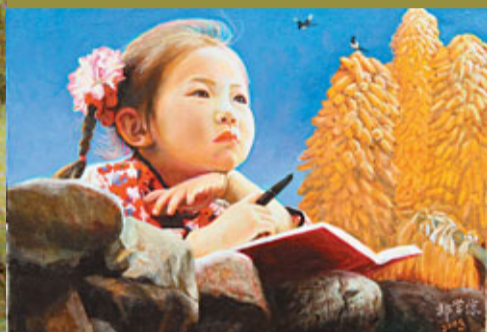
郭常信作品《秋天的日記》