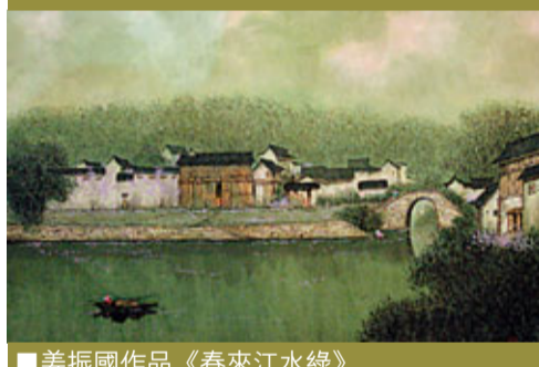
姜振國作品《春來江水綠》