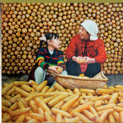
郭常信作品《扒玉米》