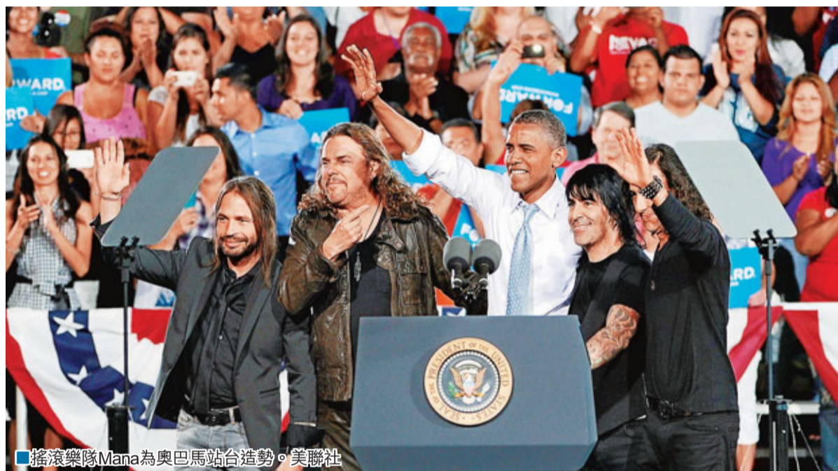
搖滾樂隊Mano為奧巴馬站台造勢。

美國總統大選首場候選人辯論，將於當地時間晚9時(香港時間周四早上9時)在丹佛舉行。角逐連任的總統奧巴馬和共和黨對手羅姆尼密鑼緊鼓備戰，在黨內找來假想敵進行「地獄式訓練」作最後衝刺。這場多達5,000萬人收看的辯論關乎選戰勝敗，一子錯也可摧毀白宮夢。最新民調