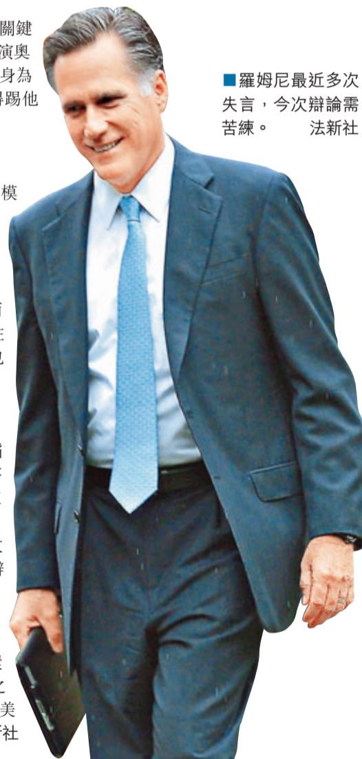
羅姆尼最近多次失言，今次辯論需苦練。