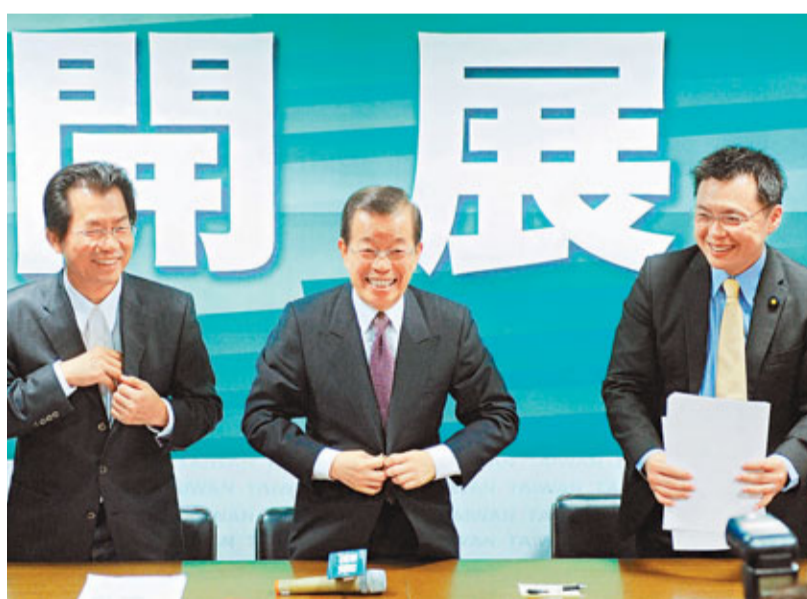
謝長廷(中)1日舉行記者會, 以「開展」為題, 說明將以民間人士身份應邀前往北京參觀國際調酒大賽的行程及立場。

《中國時報》分析, 兩岸政策如何調整已成為民進黨要務之一, 蘇貞昌若繼續以拖待變, 恐將在謝長廷「大膽西進」引發的政治效應中, 淪為陪襯角色。