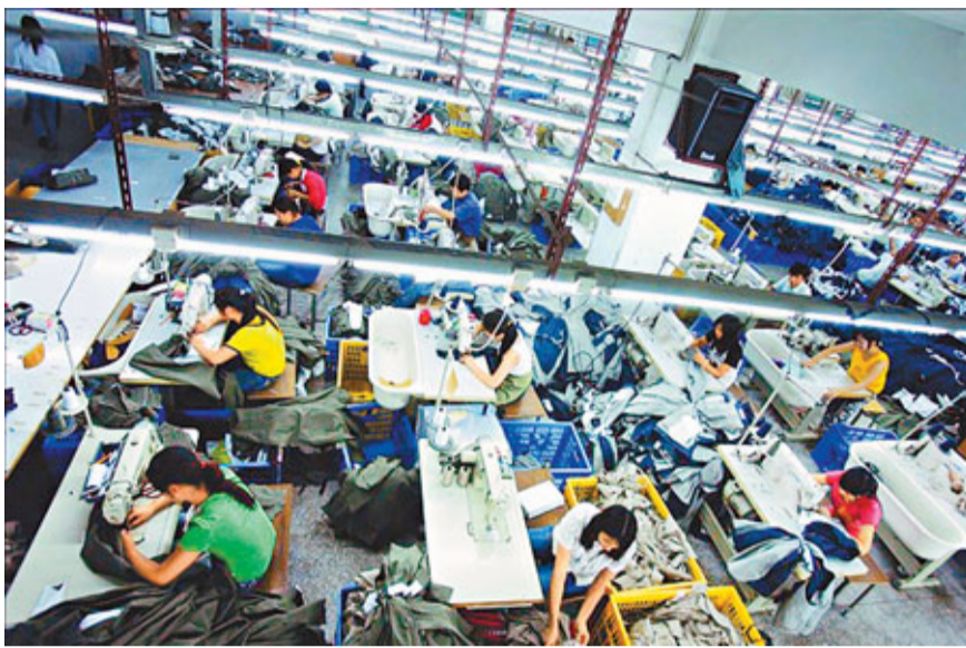
PMI上升表明內地製造業生產情況有所改善。

另一個值得關注的現象是, 最近兩月購進價格指數回升明顯, 本月主要原材料購進價格指數為51.0%, 比上月大幅上升4.9個百分點, 在連續4個月低於臨界點後, 本月重新回到50%以上, 這表明製造業主要原材料購進價格整體水平由降轉升, 企業原材料採購成本有所加大。考慮到國際上許多國家為刺激經濟增長普遍採用寬鬆貨幣政策, 輸入性通脹壓力有所增加, 所以宏觀政策方面仍要注意預防上游產品價格強力反彈。