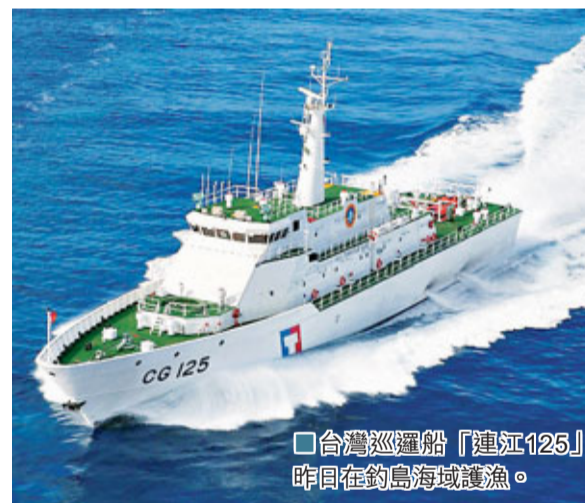
■台灣巡邏船「連江125」昨回在釣魚海域巡邏。

香港文匯報訊 據人民網東京1日消息，日本海上保安廳稱，當地時間1日中午12時35分左右（北京時間11時35分），4艘中國海監船相繼進入釣魚島附屬島嶼黃尾嶼「毗鄰區」。