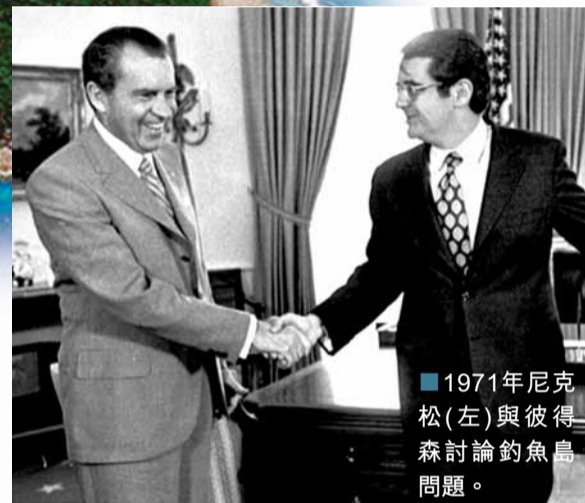
■1971年尼克松(左)與彼得森討論釣魚島問題。

關於釣魚島的歸屬問題，羅援將軍曾多次在公開場合宣稱，釣魚列島不屬於琉球列島，而屬於中國。他曾指出，《舊金山和約》第二章第三條中規定的置於聯合國託管制度之下的領土，並不包括釣魚島。釣魚島自古以來是屬於中國的，早在明朝初年，釣魚列島就在我國版圖之內，就連日本天明五年(1785年)出版的《三國通覽圖說》之附圖《琉球三省並三十六島之圖》