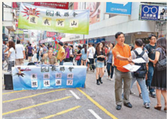
■教聯會昨日在旺角行人專用區向途人派發單張，講述香港保釣40年風雨。

香港文匯報訊 據中新社報道，日本橫濱華僑總會1日在橫濱市內舉行慶祝新中國成立63周年招待會。中國駐日大使程華(見圖)表示，日方「購島」行為嚴重侵犯中國的領土主權，中國捍衛領土主權的決心和意志堅定不移，日方應以實際行動糾正錯誤，使兩國關係回到健康穩定發展軌道。