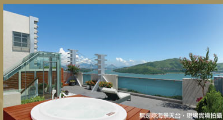
無邊際海景天台, 現場實境拍攝

單位建築面積為 1,883 及 1,893 平方呎 只餘高層全無遮擋海景單位 8 伙 售價僅由 1,623 萬起 每呎僅售 8,575 元