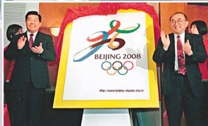
2000年2月1日，北京2008年奧運會申辦委員會在北京舉行第二次全體會議，確定了北京2008年奧申委會徽和「新北京，新奧運」的申辦口號，賈慶林（左）和伍紹祖為會徽揭牌。