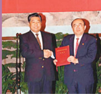
伍紹祖向賈慶林遞交申奧書。