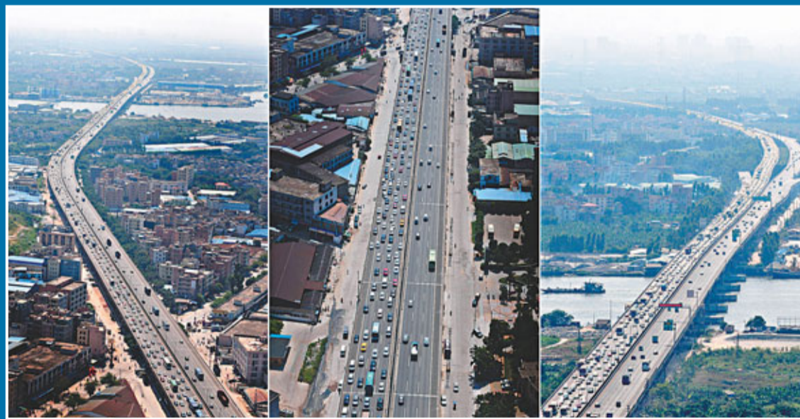
航拍直擊廣東高速公路免費首日路況。圖為9月30日,廣深高速不少路段都非常擁堵(拼版照片)。