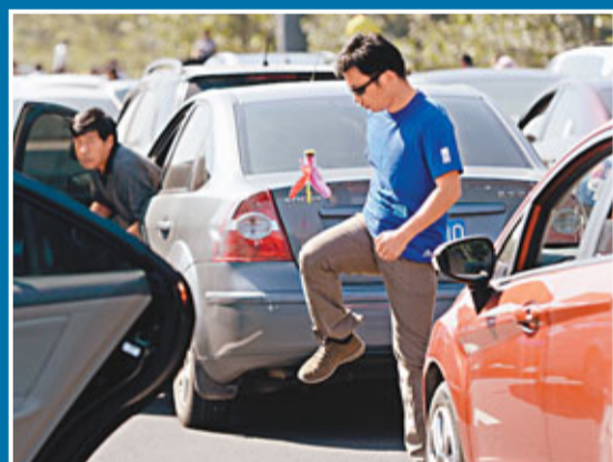
京滬高速天津段嚴重擁堵,一名車主在堵車長龍中踢毽消磨時間。