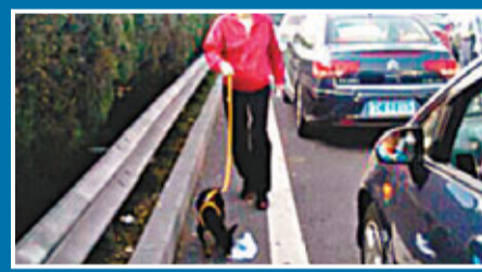
網傳滬昆高速一名女士的「遛狗圖」。