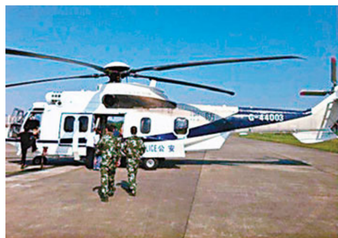
中秋國慶假期首日,廣東24條高速公路大擁堵,警方派出兩架直升機啟動空地聯動。

香港文匯報訊(記者 古寧 廣州報導)內地高速公路7座及以下小型客車中秋國慶放假期間免費,假期首日(9月30日)廣東省各高速路都出現擁堵,從9月30日零時到9月30日上午,粵東、粵西、粵北、珠三角方向等共24條高速公路均發生交通擁堵,有的車龍最長達二三十公里,部分高速公路要實行封閉、分流等交通管制措施。