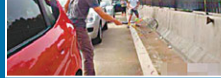
深汕高速大面積擁堵,車主下車打網球。