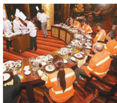
中秋佳節，山西太原一商家邀請環衛工人吃鮑魚，品紅酒，享用中秋佳宴。

新聞頻道從昨天開始，連續四天推出「錢塘觀潮」系列直播，陸海空多角度拍攝錢塘潮的推進過程，央視前方記者在海寧嘉紹大橋和鹽官古鎮直播錢塘夜潮盛景，享受賞中秋月、聽錢塘潮的悠遠意境。1日，新聞頻道從5點02分開始到8點20分，將追蹤太陽的軌跡，直播中國從東到西各地壯闊的日出場景，記錄「日出東方」下的壯美河山。