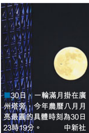
30日，一輪滿月掛在廣州塔旁，今年農曆八月月最圓的具體時刻為30日23時19分。

據新華社30日電 天文專家表示，今年中秋月雖然在上午11時達到最圓，但傍晚時分的明月依然珠圓玉潤，絲毫沒有影響到人們賞月、觀月。巧合的是，繼去年和今年之後，明年的中秋月依然是「十五的月亮十五圓」。