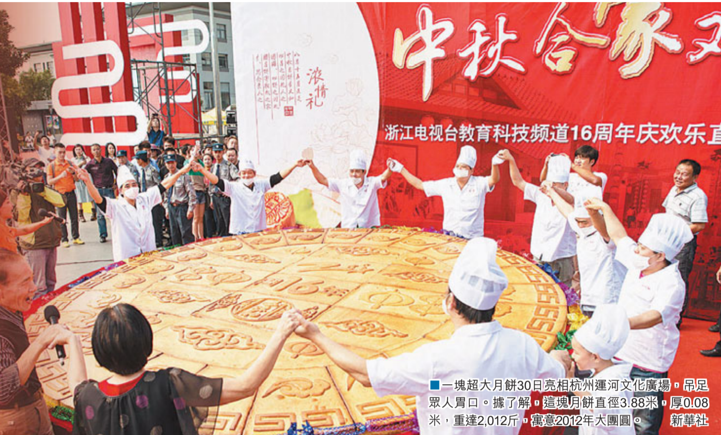
一塊超大月餅30日亮相杭州運河文化廣場，吊足眾人胃口。據了解，這塊月餅直徑3.88米，厚0.08米，重達2,012斤，寓意2012年大團圓。

香港文匯報訊 據中新社電：在中國人的精神家園裡，家和萬事興，團圓最幸福，國泰民安最無價。據中央電視台新聞聯播報道，中秋來臨，在山東濟南，泰安皮影、鼓子秧歌等民俗表演，讓人目不暇接。燈籠、門聯將福建南靖的土樓人家裝扮一新，街坊四鄰用閩南特有的「博餅」民俗歡度中秋。