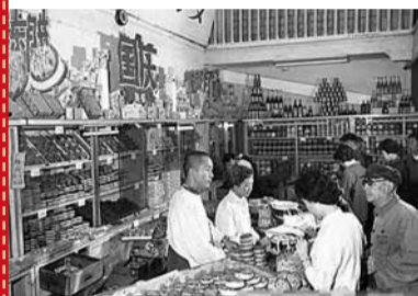
1963年國慶節、中秋節接踵而來，為了讓人們過好中秋節，北京各食品商店準備了各色中秋月餅。