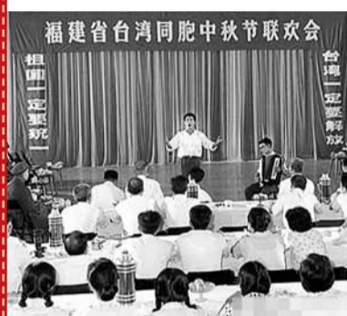
1978年9月16日中秋前夕，在福建各地工作的一些台灣省籍同胞聚集福州，歡度佳節。 網上圖片