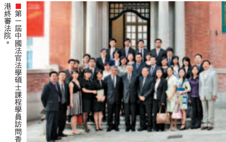
第一屆中國法官法學碩士課程學員訪問香港終審法院。