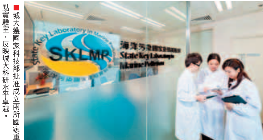
城大獲國家科技部批准成立兩所國家重點實驗室，反映城大科研水平卓越。

城大還為內地的政府、企業等機構提供各類培訓。2009年，城大法律學院與最高人民法院及其所轄國家法官學院合作培訓中國內地法官，至今已有逾二百名內地法官分別完成長達一年的法學碩士課程和為期一個月的高級法官研習班，另有20名內地法官正在城大研讀全國首創、為期三年的「中國法官法學博士課程」。這一舉措開創了中港兩地法律界合作培訓人才的先河，不僅可以促進兩地法律界的交流，加深中國法官對國際司法體系及運作的了解，為內地司法體制的健全和進步作出應有的貢獻，同時也令城大的法律專業學生有機會與內地的現職法官接觸並交流。