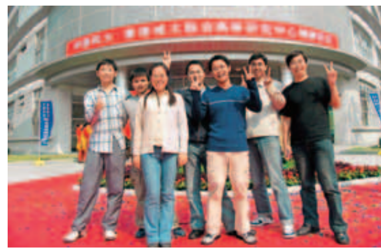
城大與中科大2005年在蘇州設立高等研究中心，聯合培養研究生。

城大亦致力拓展機會與內地合作培養人才。2005年城大與中國科學技術大學在蘇州聯合設立高等研究中心，促成兩校合作研究、聯合培養研究生，並為之提供專業訓練。城大還與中國科技大學、中山大學、武漢大學等內地高校建立起聯合培養研究生模式，以促進人才培養和研究課題兩方面的交流與進步。