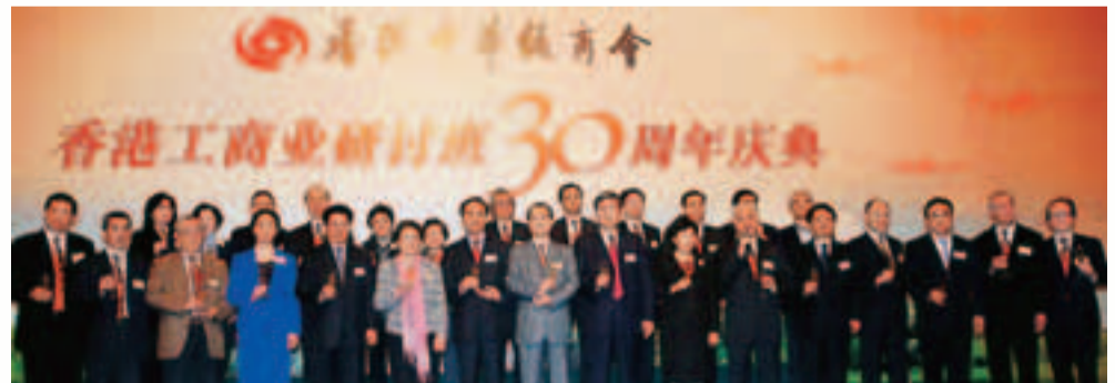
香港工商業研討班的學員皆學有所成，當中不少擢升至國家和省部級的領導崗位，如全國人大陳昌智副委員長及全國政協黃孟復副主席等。圖為今年慶祝研討班創辦30周年慶典活動。

中總帶領慶祝首個國慶日 五星旗在香港飄揚 華商總會開會通過 今日懸旗放假一日 「國慶60周年千萬行」步行籌款是中總慶祝60周年國慶的重點活動之一，為香港公益金籌得1,000萬元善款。