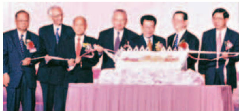
李瑞環主席(右三)親臨香港出席百年慶典。

每年「兩會」，擔任全國人大代表及全國政協委員之中總成員均積極建言獻策，如蔡冠深會長在今年全國政協會議上提出多個議題，包括協助內地與香港企業聯合「走出去」、發揮香港優勢協助國家「軟實力」走向海外等，備受政府及各界人士重視。