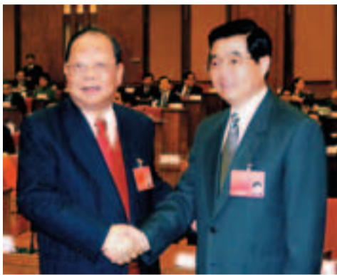
胡錦濤主席(左)與曾憲梓會長親握手。

經過連年奮鬥，今天祖國經濟成就有目共睹。為進一步配合國家經濟策略及發展方向，中總全力推動香港與內地各經濟區域融合。