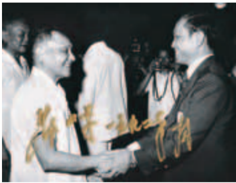
鄧小平(左)在北京首都體育場貴賓室接見霍英東會長。

今年是中華人民共和國成立63周年，近年祖國經濟騰飛、種種成就莫不令人自豪鼓舞。63年來，香港中華總商會一直秉承愛國愛港的優良傳統，一代接一代的中總成員薪火相傳，在建設祖國及香港經濟、構建經貿橋樑、慈善公益等方面與香港社會同步向前，堅定不移的愛國精神更屢獲國家領導人讚賞。