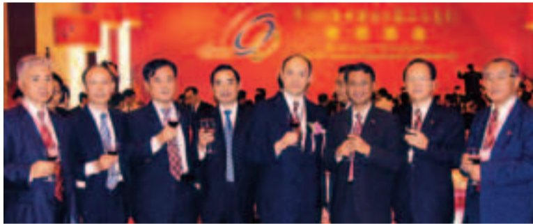
自首屆廣交會起，中總必組團出席，並受貿促會委託代向香港地區的華商發帖，至2000年為止。