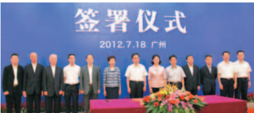
在與廣東省對外經濟貿易合作廳簽署合作協議儀式上，廣東省朱小丹省長(中)、香港特區政府林鄭月娥政務司長(左六)及廣東省招玉芳副省長(右六)等親臨見證。