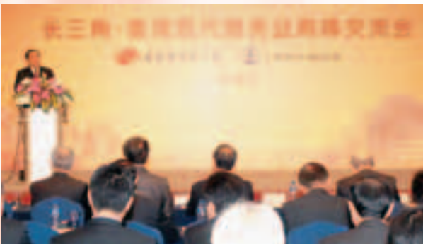
致力拓展香港與長三角在現代服務業方面的互動合作空間。