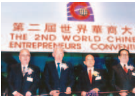
來自22個國家及地區逾800人出席在香港舉辦的第二屆「世界華商大會」。