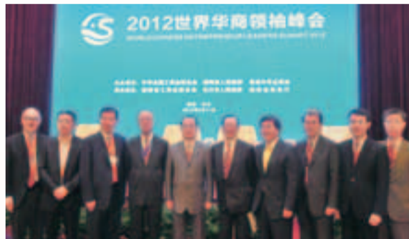
「世界華商領袖峰會」兩年一度在各省會城市輪流舉行，藉此加強各地華商對國家最新發展的了解。