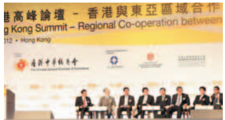
「香港高峰論壇」廣邀中國及東亞國家共11位部長級官員探討香港在促進東亞區域合作的角色。