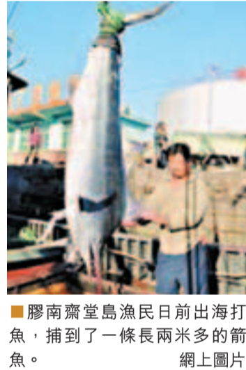
膠南齋堂島漁民日前出海打魚，捕到了一條長兩米多的箭魚。