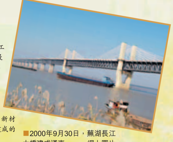
2000年9月30日，蕪湖長江大橋建成通車。

2000年9月30日，鐵道部和安徽省在蕪湖長江大橋上舉行該橋建成通車典禮，慶祝這座被稱為在中國橋樑史上繼武漢、南京、九江長江大橋之後的第四座里程碑順利建成。中共中央政治局委員、國務院副總理吳邦國對蕪湖長江大橋的建成作了重要批示。他說：蕪湖長江大橋的建成，使我國橋樑建設水平跨上了一個新台階，對安徽和華東地區經濟發展有着重要意義。希望全體參建職工再接再厲，再創鐵路建設新成績。 蕪湖長江大橋是國家「九五」重點工程，是上世紀末我國在長江上修建的最後一座公路、鐵路兩用橋，也是我國第一座公、鐵兩用斜拉橋。鐵路橋長10,624.4米，公路橋長6,078.4米，工程浩大，相當於武漢、南京兩座長江大橋的總和；在設計、製造、施工方面，採用了十幾項新結構、新技術、新材料、新工藝，科技含量在我國當時已建成的橋樑中是最高的。