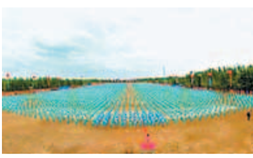
吉林四平，萬人花棍舞挑戰健力士世界紀錄表演現場。

香港文匯報訊（記者 張艷利 吉林報導）2012中國·四平萬人花棍舞挑戰健力士世界紀錄表演大會28日於吉林四平舉行。來自四平市鐵東區13所中小學的10,098名學生成功挑戰了長達8分30秒的滿族花棍舞健力士世界紀錄，並獲「萬人花棍舞表演紀錄證書」。