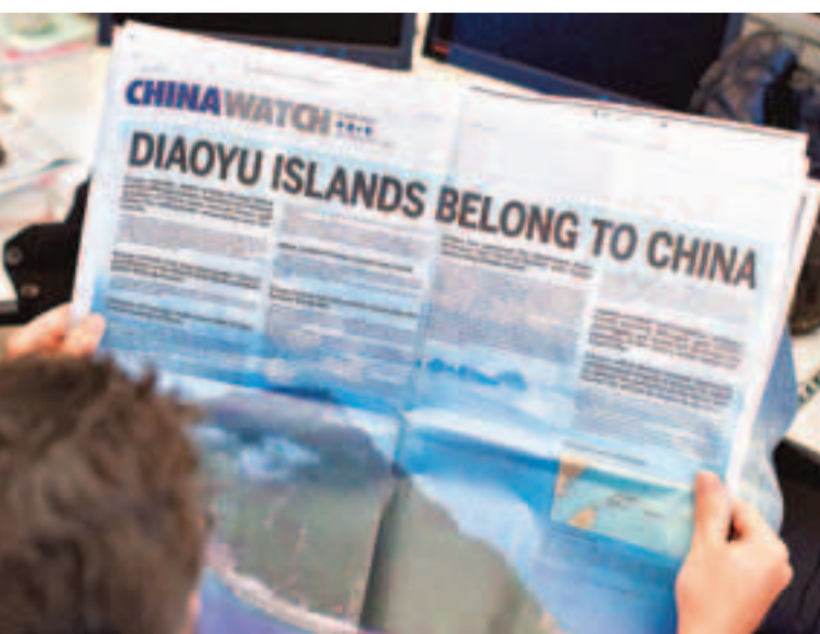
《中國日報》在美國報章刊登「釣魚島是中國領土」的廣告。路透社的片面見解,將給(美國輿論)造成誤解。我們認為不能坐視。」據悉,《華盛頓郵報》針對日方的抗議表示,報社並不支持廣告的內容,「對日本政府提出交涉一事予以留意」。