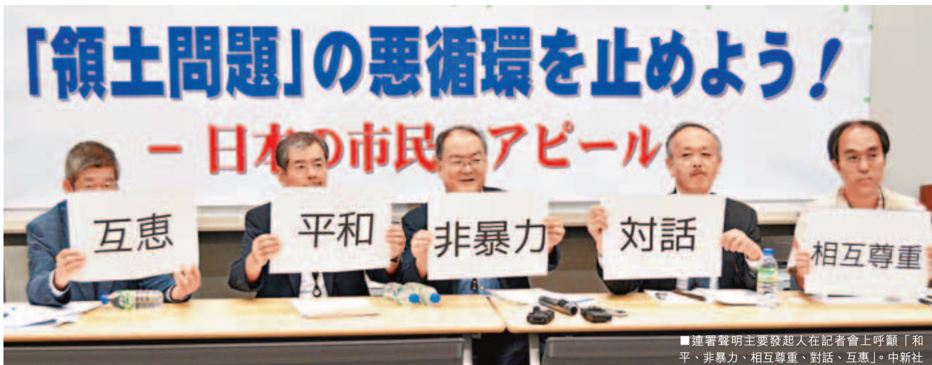
連署聲明主要發起人在記者會上呼籲「和平、非暴力、相互尊重、對話、互惠」。