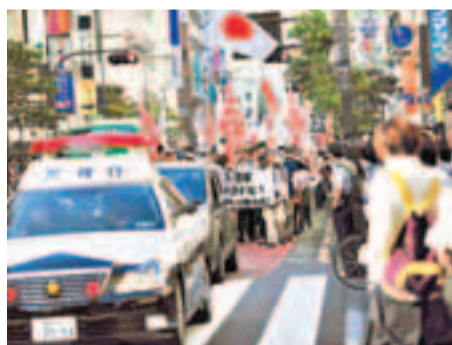
日本右翼遊行隊伍在池袋主幹路上行進。中新社

香港文匯報訊 據中新社報道,日本右翼組織29日在東京池袋附近舉行了約兩百人規模的反華遊行。當天遊行沒有造成人員傷亡及財產損失。