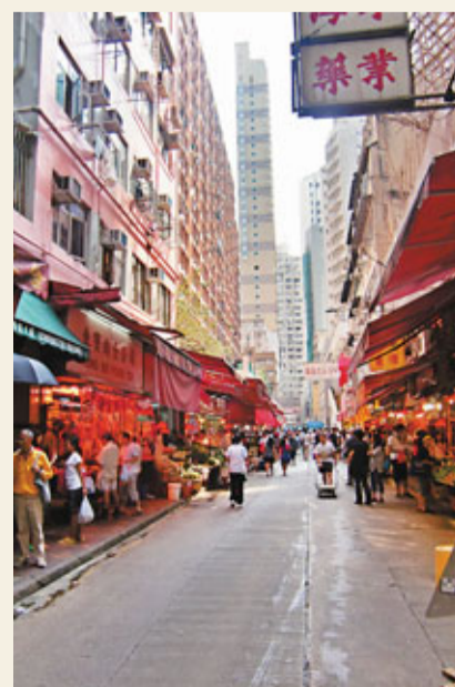
■今年中秋市民多選擇外出用膳，令街市的生意大受影響。

香港文匯報訊 (記者 李淑貞) 今天是中秋節，但不少街市檔主表示今年中秋與國慶假期相連，市民多趁4日假期外遊；加上經濟好轉，市民多選擇外出用膳，令街市的生意大受影響，而昨日的街市亦十分冷清。有魚檔檔主