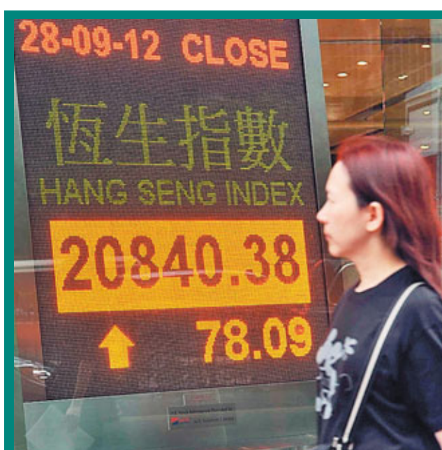
■ 港股第三季最後一個交易日，收升78點，成交507億元。

雖然地產股已有一定升幅，但他仍推介地產龍頭長實(0001)，因為其股價折讓仍高達三至四成，又沒有官司纏身，視為投資首選。第二則選新地(0016)，雖然其折