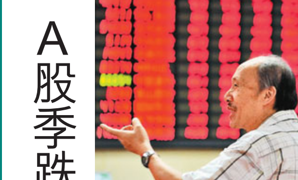
■ A股繼續反彈，中秋國慶紅包得以派發，股民笑逐顏開。新華社

至於國指成份股中，升幅最大的股份同樣是電訊股，中電訊(0728)本季升32.9%，與聯通同步。QE3出台令資源股有反持，中海油田(2883)升27%排第二，紫金(2899)升20%佔第三。本季表現最差的國指成份股前二位，是兩隻被中日關係急轉直下而打擊的汽車股，東風(0489)本季跌23.9%，廣汽(2238)跌20.9%。