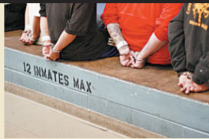
犯人一般在入獄後頭七天感受到天堂與地獄的差別。