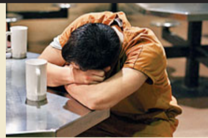
監獄是一個消磨人心志的地方，長久下去可以逼瘋一個人。