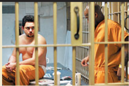
監獄生活可以喚醒人的鬥志，也可擊潰一個人的意志。