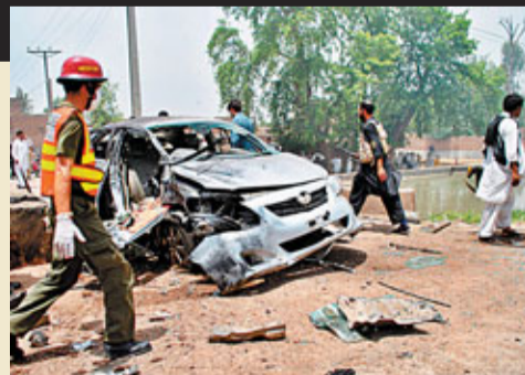
汽車襲擊在美國很常見。

了。不是不是很滑稽？但美國就是充斥着大量類似的法律，鑽移民法的漏洞、違反環境保護條例或觸犯神秘的商業法，在美國都被判刑，這也就不難理解為甚麼美國的犯罪率特別高。犯罪變得容易了，別說公眾弄不清自己為甚麼犯法，連法律專家有時也弄不清某些法律。其中一條叫「誠信服務欺詐罪」(honest services fraud)，足以讓每個人都有變成罪犯的可能。「Three strikes law」是針對刑事慣犯而設計的一條法律，卻被州政府濫用。藥物條例本身是針對藥物非法交易而定立的，現在不當販賣藥物處方也會招致刑罰，分鐘被監禁15年。不論是殺人犯、強姦犯、暴力狂，還