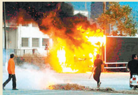
美國去年的縱火案數字略微下滑。法新社 圖片

是藥商、年少輕狂的年輕人，都因為大大小小的法律而被送入監獄，接受數年至數十年不等的刑期，而大部分人都不是所謂的危險人物。