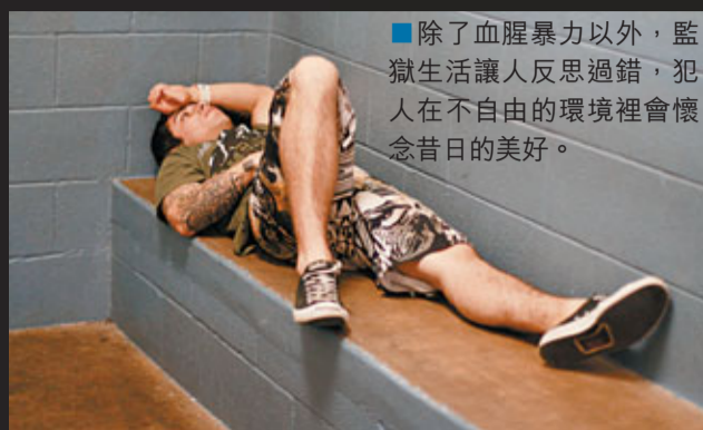
除了血腥暴力以外，監獄生活讓人反思過錯，犯人在不自由的環境裡會懷念昔日的美好。

上世紀八九十年代，電影《監獄風雲》揭露監獄內幕，血腥暴力的場面讓人膽戰心驚，人性的陰暗面也被詮釋得淋漓盡致。後來，美國同名電視劇也帶來了監獄中的點點滴滴，透過集中描述一個監獄所發生的各種事，帶出監獄生活的複雜性。而最近，Discovery頻道播放的《監獄新人週記》(First Week In)則採取鏡頭監控的方式，紀錄囚犯入獄後第一個星期面臨的精神壓力與際遇變化，真實的監獄生活與電影劇情其實是兩碼子事。