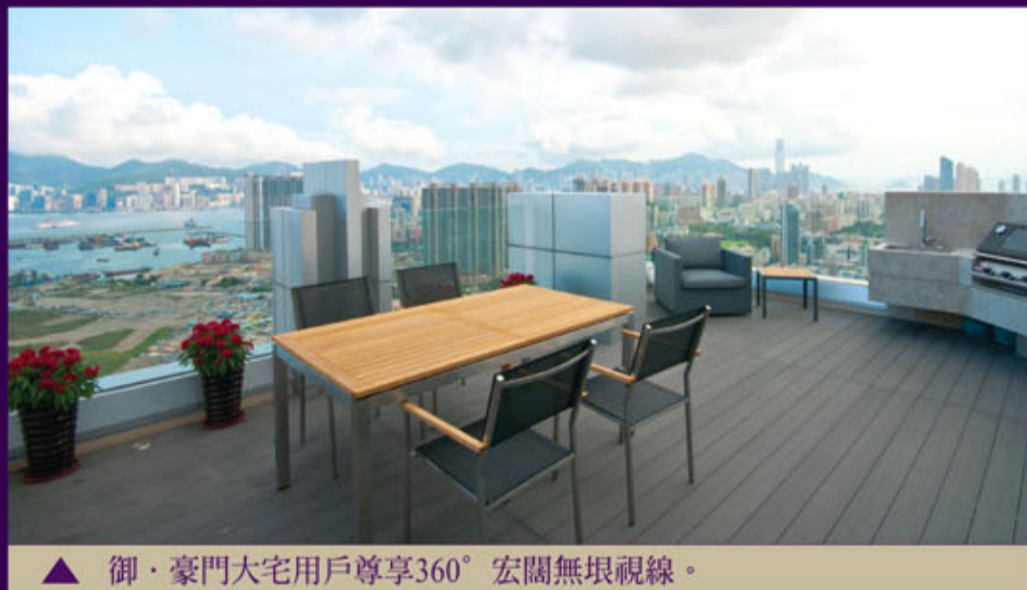
▲ 御·豪門大宅用戶尊享360°宏闊無垠視線。

御·豪門的 Grand Billionnaire Royale「御·豪門大宅」，珍藏八個特色大宅：2,792平方呎複式示範大宅、2,691平方呎複式大宅、兩個2,651平方呎三複式大宅尊擁754平方呎天台連私人按摩池、2,062平方呎特色大宅連965平方呎天台及私人按摩池、2,019平方呎特色大宅連天台，以及兩個2,289平方呎四房雙套特色大宅，各具特色。