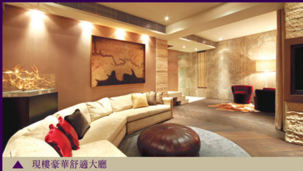
▲ 現樓豪華舒適大廳