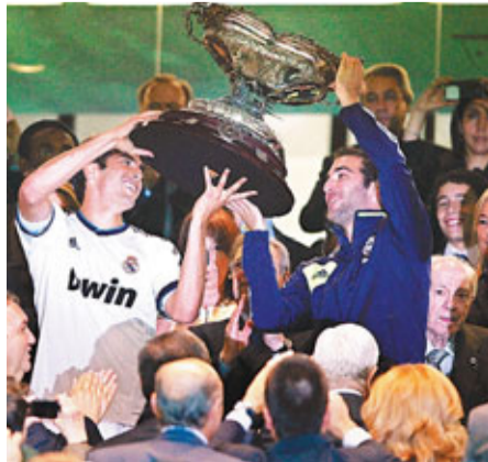
卡卡(左)與希古恩捧起班拿貝盃。

西甲開季欠順的皇家馬德里昨晨在含金量不高的班拿貝盃主場狂炒哥倫比亞一支弱旅8:0，力奪8連冠。今季已被教練摩連奴視為「後備之後備」的巴西中場球星卡