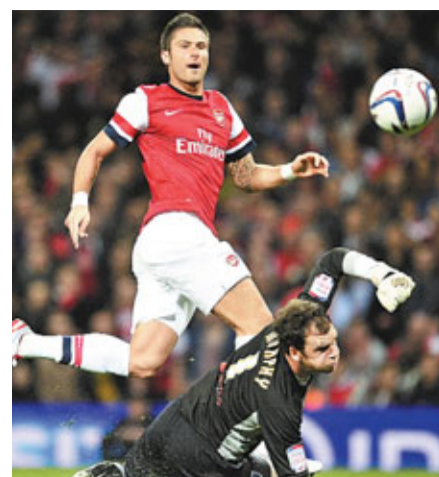
基奧特(上)施射得手開紀錄。

禾確特上周透露自己不想只踢邊路，希望擔任前鋒，才遲遲未動筆續約。領隊雲加表示，「禾仔」還需耐心等待這個機會，他說：「現在鋒線競爭很大，他需保持耐性。」另養傷14個月