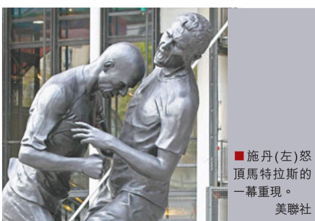
施丹(左)怒頂馬特拉斯的一幕重現。

意大利在2006年德國世界盃決賽中互射12碼擊敗法國捧盃，退役前最後一次披甲的法國球星施丹在加時因不甘遭到馬特拉斯的出言侮辱，出動鐵頭怒頂對方，直接領紅牌黯然被逐離場。這經典歷史一幕甚至成為了藝術家靈感的來源，施丹怒頂馬特拉斯的雕像近日就在法國巴黎龐比度國家藝術文化中心展覽館門前公開展出。雕塑出自阿貝德賽梅之手，而這位藝術家的出生地正是施丹的老家阿爾及利亞。