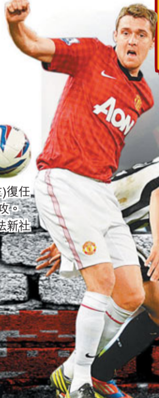
朗尼右膝的傷疤清晰可見。