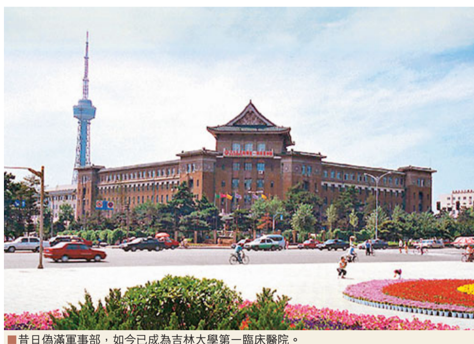
昔日偽滿軍事部，如今已成為吉林大學第一臨床醫院。

建國後，這裡成為地質宮廣場，作為長春市的大型集會廣場，在全市的政治生活中有着不可取代的作用。上世紀80年代初，廣