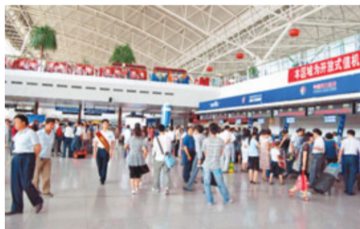
由「十一長假」引爆的出行潮,炒熱了機票和旅遊市場。圖為假期前,機場航站樓內熙熙攘攘的場景。

香港文匯報訊 據《南方日報》報道,距離「十一長假」只有3天,由8天長假引爆的出行熱潮早就炒熱了機票和旅遊市場。據記者了解,「十一」機票、酒店預訂早從9月中旬就開始大幅攀升了,熱門旅遊城市的機票價格在9月26日至10月1日之間漲至了最高點,大部分航線價格漲幅超過100%,熱門時間段的機票甚至提前20天就已售罄;酒店價格從10月1日至10月5日之間一直「高燒不退」。