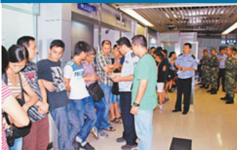
■羅湖口岸每日截查成百上千水客。

據了解，水客通常分為職業和兼職兩種。職業水客中，既有香港本地人，也有以「個人遊」出入香港的內地居民，他們每天靠帶貨來賺取生活費。隨著「個人遊」人數增多，兼職水客群體也日漸龐大，深港兩地的學生、上班族、跨境家庭主婦、老人等也開始以偶爾或順便的形式帶貨。這些兼職水客數量激增，他們所攜帶的走私物品卻越來越生活化，價值越來越低，海關緝私局負責人向記者坦言，抓走私幾百元物品的水客，海關需投入的人力物力成本可能是貨值的幾倍。