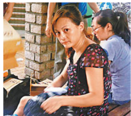
■水客眼神「警覺」。

深港陸路口岸的水客走私始於上世紀80年代，但近幾年內地開通赴港「一簽多行」，少數不法分子利用進出境的便利條件，加入到「水客」行列，口岸「水客」數量隨即激增，且逐漸呈現職業化、組織化的發展趨勢，給海關帶來巨大的監管壓力。深圳海關承認，目前活躍在深圳各大口岸的水客超過2萬。