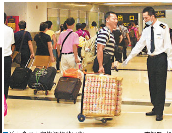
■益力多是水客搬運的熱門貨。