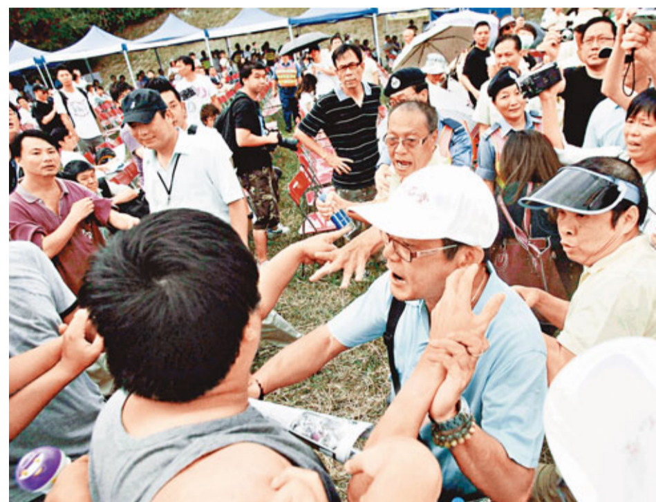
■新界發展諮詢會期間，支持與反對雙方多次爆發肢體衝突。

香港文匯報訊（記者 鄭治祖）立法會選舉由終人散，但政治氣氛毫無淡化跡象，反而愈見升溫。反國民教育、「光復上水」、反新界東北規劃，這些表面上並不相關的事件背後，隱隱可見一隻「無形之手」在操控議題、發酵爭議、刺激對立、製造分化，並透過輿論攻勢、號召示威遊行、集會論壇及遍地開花的聚沙成塔式滲入，將幾個議題有機結合、互為促進，形成一股「去中國化」的力量。拆解「幾大戰局」的幕後幕前一眾搞手，只見一張編織得甚為綿密的關係網（見表），暴露了一個堪稱為反對派「黑手黨」的團夥，層層疊疊、彼此交叉，複雜程度較娛樂圈情侶圖更甚，亦可見反對派亂港行動的組織嚴密、殺機處處。