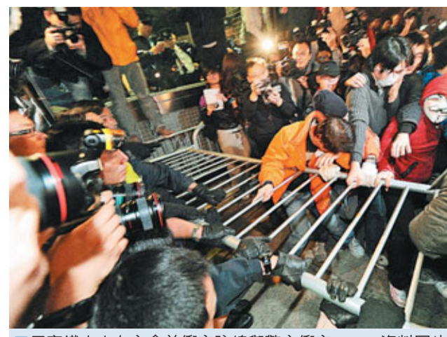
■反高鐵人士在立法會前衝突防線與警方衝突。

政府在與當區居民的協調、溝通製造障礙，令發展規劃受阻，房屋興建及土地供應也會受到影響，且會不斷推高日後收地的賠償，最終由香港納稅人「買單」。