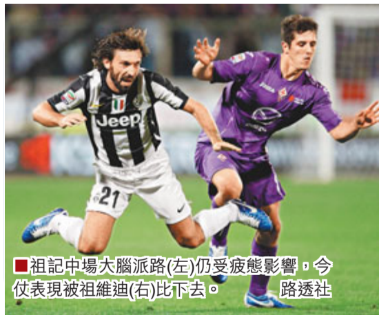
祖記中场大腦派路(左)仍受疲態影響，今仗表現被祖維迪(右)比下去。