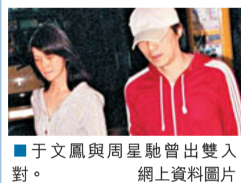
于文鳳與周星馳曾雙入網。

香港文匯報訊(記者 杜法祖)「星爺」周星馳與名下公司,遭前女友于文鳳追討投資山頂普樂道豪宅的7,000多萬元佣金,案件昨首度提訊,由於周的公司要求剔除出答辯人之列,但于文鳳反對,聆案官遂指示雙方律師呈交誓章列出申請及反對理據,日後再排期聆訊,並預留3小時審訊時間。提出剔除申請的是周星馳名下公司星揚海外有限公司,日後聆訊時周星馳毋須派代表出庭。聆案官下令星揚海外於28天內呈交誓章列出申請理據,之後于文鳳有28天時間回應。與星爺拍拖13年的于文鳳,指她當年促成星爺以3.2億元投資山頂普樂道超級豪宅「天比高」項目,星爺口頭承諾會支付她8,000萬元佣金,但最終只給她1,000萬元,于遂入稟追討逾7,000萬元尾數。