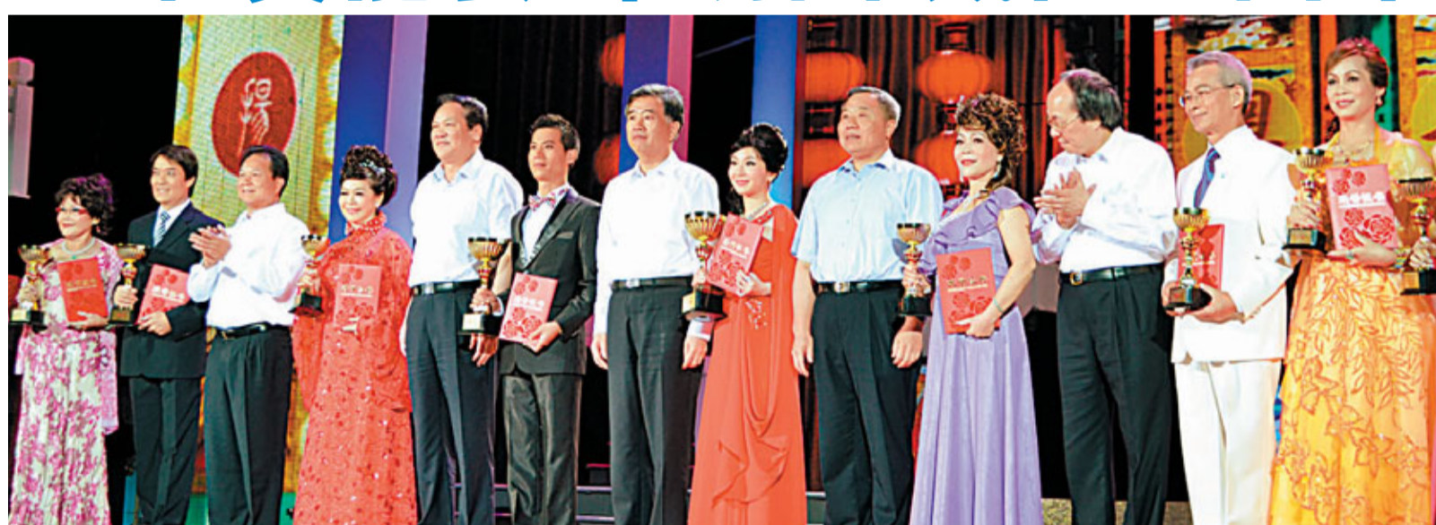
中共中央政治局委員、廣東省委書記汪洋，廣東省政協主席黃龍雲，廣東省委副書記朱明國，省政協副主席湯炳權，香港四洲集團主席戴德豐與總決賽金、銀、銅獎獲得者合影。