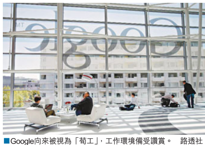
Google向來被視為「苟工」，工作環境備受讚賞。路透社