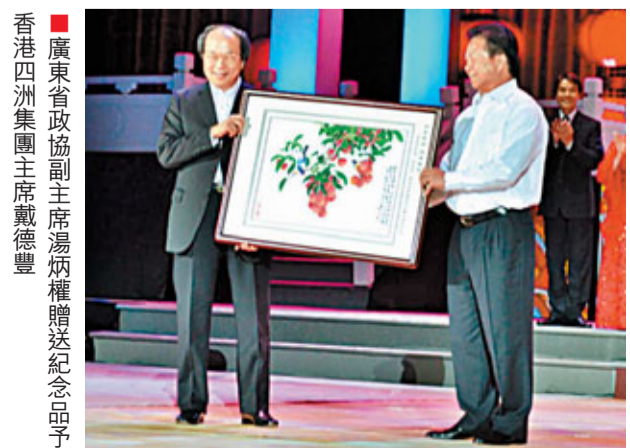
廣東省政協副主席湯炳權贈送紀念品予香港四洲集團主席戴德豐