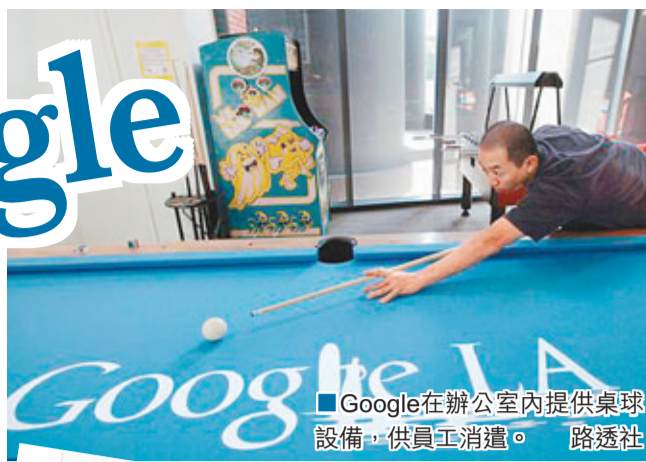
Google在辦公室內提供桌球設備，供員工消遣。