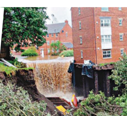
英格蘭住宅地基沖毀。

英國北部部分地區一天錄得平時逾一個月的雨量，北約克郡凱恩維克雨量更達89毫米。環境部門發出73個洪水警告，以及164個較輕微的水浸警報，預計到本周後期天氣才會好轉。