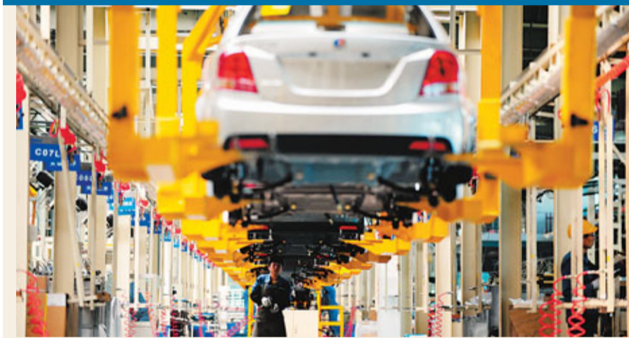
■吉利汽車生產基地落戶蘭州新區。圖為一名工人正在汽車組裝流水線上工作。