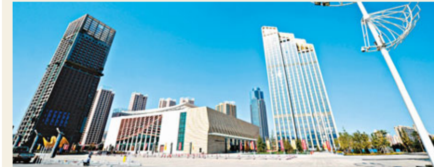
■「外灘」拔地而起的國際會展中心建築群，被民眾視為蘭州新地標。

香港文匯報訊（記者 李楊、朱世強 蘭州報道）今年8月20日，國務院下發《關於同意設立蘭州新區的批覆》，蘭州新區成為繼上海浦東新區、天津濱海新區、重慶兩江新區、浙江舟山群島新區後，第五個國家級新區。同時，它也是西北地區唯一的國家級新區。