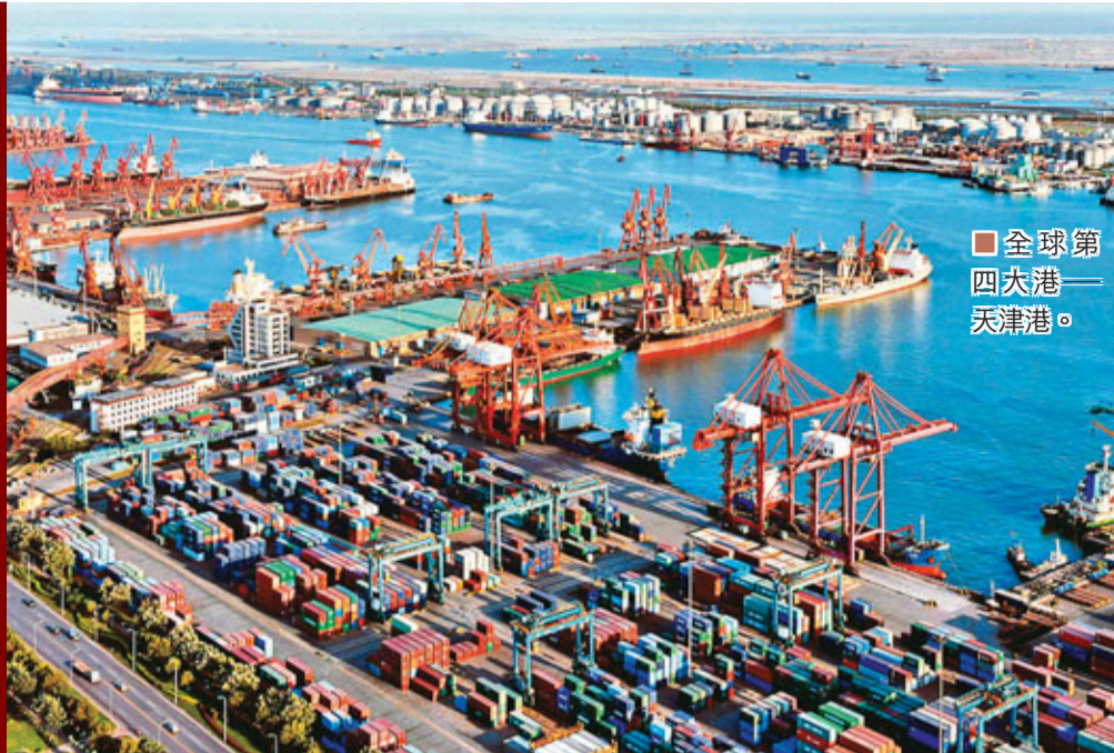
■全球第四大港——天津港。