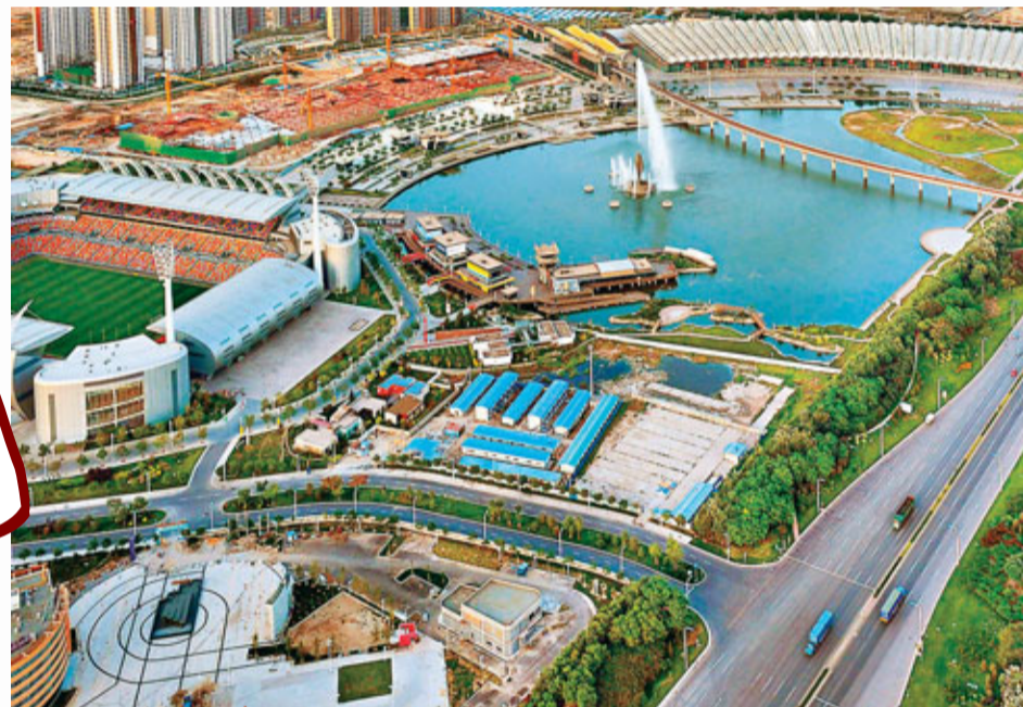
■濱海新區會展中心。