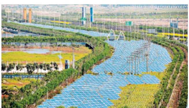
■中新天津生態城中央大道光伏項目。

作為中國、新加坡兩國政府合作的典範，坐落於濱海新區的中新天津生態城，為中國乃至世界其他城市提供了可持續發展的樣板。這裡曾經是一塊無人居住的荒地，30平方公里範圍內，三分之一是廢棄鹽田，三分之一鹽鹼地，三分之一污染水面，土壤鹽化、淡水缺乏。經過四年的努力，生態城共治理污水215萬方、污泥385