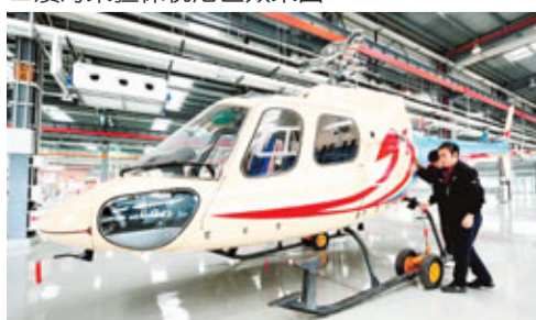
■中航直升機天津產業基地。