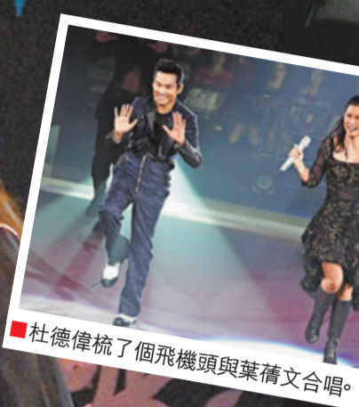
杜德偉梳了個飛機頭與葉蒨文合唱。