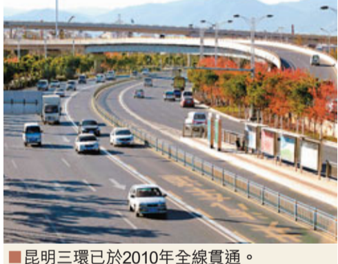
■昆明三環已於2010年全線貫通。