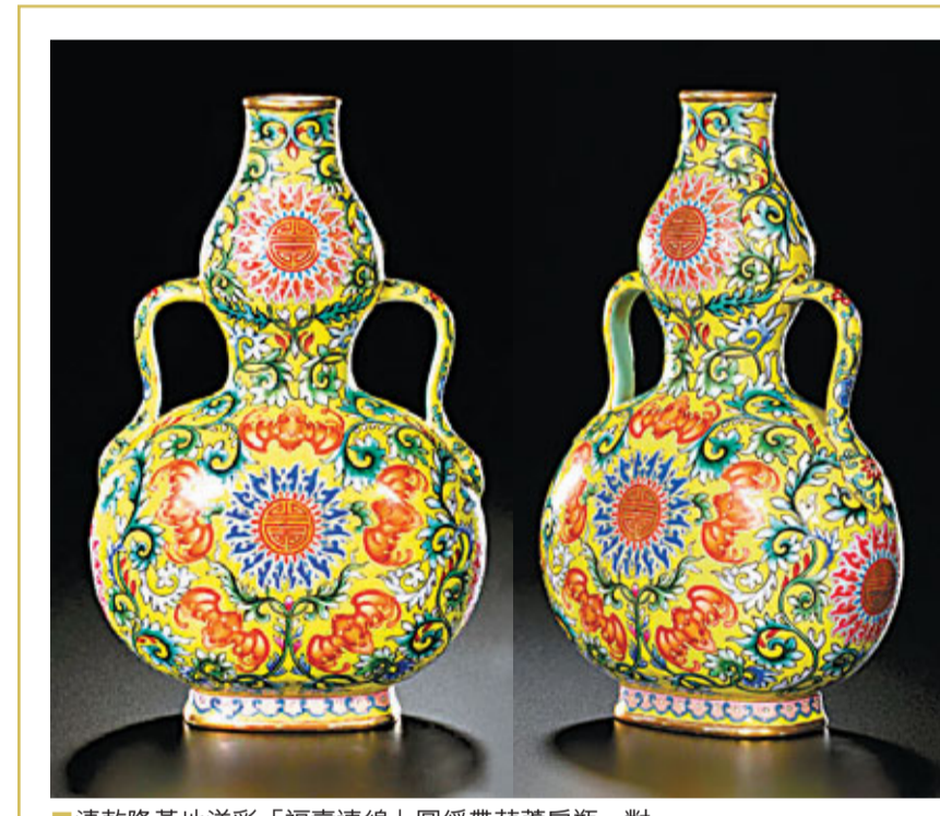
清乾隆黃地洋彩「福壽連綿」圖綉帶葫蘆扁瓶一對

至於這兩百三十件頂級品都到了何等精絕境界，沈恩文翻開拍賣圖錄共同與我們分享。在「重要中國瓷器及工藝品」專場，有一對清乾隆黃地洋彩「福壽連綿」圖綉帶葫蘆扁瓶，瓶底有《大清乾隆年製》款。沈恩文指着這對絢麗耀目的葫蘆扁瓶講：「洋彩與珐瑯彩份屬兄弟，同是精美的釉彩，你看黃地上綴滿纏枝花紋，五隻金紅的蝙蝠環繞葫蘆內的一個「壽」字，寓意喜慶吉祥，黃地是皇家色彩，平民不得僭越，是專供皇室賞玩的。這對葫蘆扁瓶是Christian Holmes 夫人舊藏，流傳有序買家盡可放心；估價四千萬至六千萬，在高峰時段是要超越逾港幣的。」