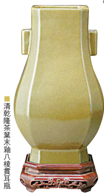
清乾隆茶葉末釉八棱貫耳瓶