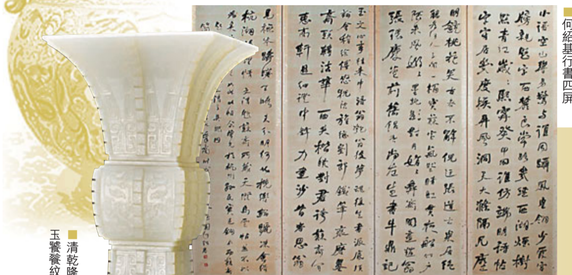
清乾隆仿古白玉饗餐紋花瓶