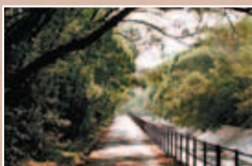
■石壁水塘旁的林蔭路

還要大的大嶼山，過去由於交通不便，未有大規模發展，幸運地保留了大量自然郊野景色，絕對是城市人的後花園。偷得浮生半日閒，去大嶼山遠足，走在綠野之間，欣賞山海之美，享受半天寧靜，再吃一頓風味妙絕的海鮮餐，絕對是賞心樂事。