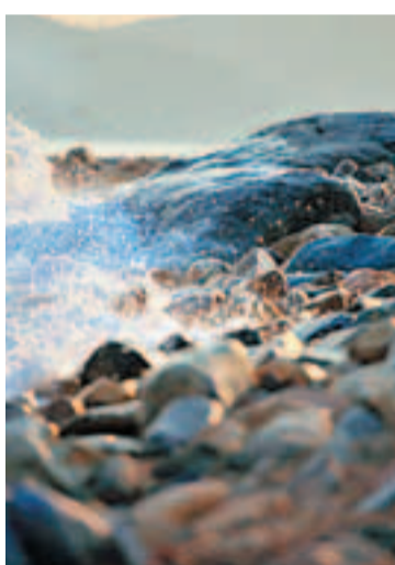
■夕陽下浪花拍打在塘福海岸的石頭上

如果早上八點從塘福出發（梅窩碼頭坐4號巴士直達），到水口村鄉公所，約需四個小時，時間來到正午，剛好是吃飯時間。行完山，消耗大量體力，自然飢腸轆轆，但大家還是最好先忍耐一下，先在水口村鄉公所對面的巴士站等車（坐1號巴士），再前往大澳享用一頓豐富的海鮮餐。給大家一個小貼士，現時每日都有本港漁民在大澳出售自內地漁船的海產，那些捕撈自深海的真正「海魚」，肉質之鮮美，絕非一般在市區海鮮酒家吃的「養魚」可比，而且價廉物美，遊人可先選購海鮮，再付當地酒家烹調加工費，埋單計數也所費無幾。