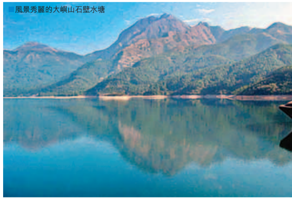
■風景秀麗的大嶼山石壁水塘