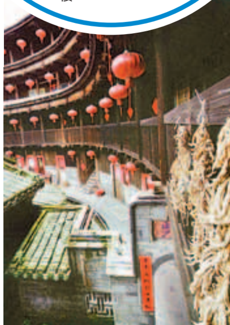
■土樓內各院落相通，具較好的抗震能力。

在福建西南部的山巒中，迴響着一首首壯觀瑰麗的中國建築圓舞曲。它們是一顆顆散落在深山峽谷裡的古堡明珠，它們是描繪一個古老民族遷徙路線的歷史畫卷，它們是種族文明碰撞融合的民俗縮影，它們是中華文化璀璨瑰寶、世界遺產名錄——福建土樓。