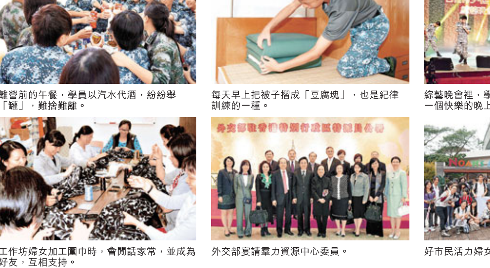
離營前的午餐，學員以汽水代酒，給給舉「釀」，難捨難離。