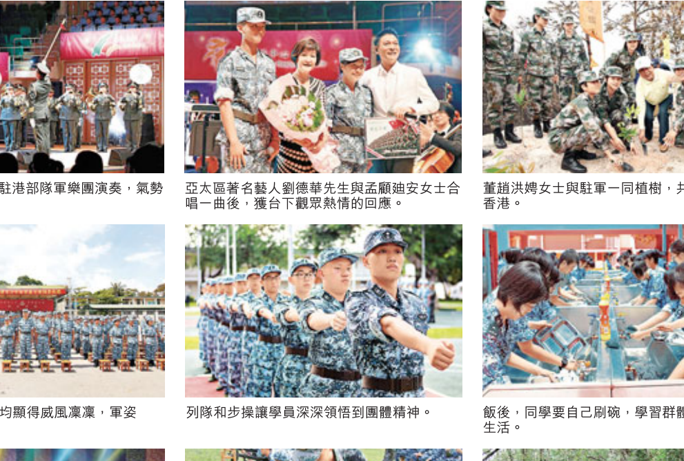
開營典禮上，學員均顯得威風凜凜，軍姿靚。