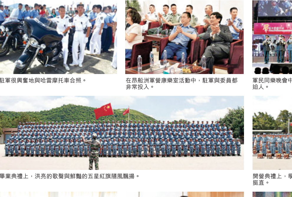
畢業典禮上，洪亮的歡聲與鮮艷的五星紅旗隨風飄揚。