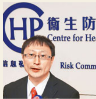
香港衛生防護中心總監曾浩輝

香港文匯報訊(記者 聶曉輝) 衛生防護中心總監曾浩輝(見圖)表示，收到世界衛生組織資料表示，從沙特阿拉伯及卡塔爾病人身上驗出與沙士病毒相關的新型冠狀病毒，惟目前未見病毒規模爆發，市民不需過於擔心。他稱，中心會加強監察，並致函私家醫生促提高警惕，又呼籲外遊人士注意衛生。