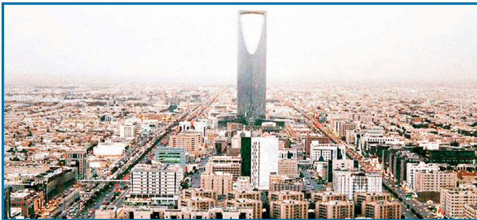
■上圖：世衛在患者體內發現與沙士病毒屬同一家族的新型冠狀病毒，其中一名患者發病前曾到訪沙特。