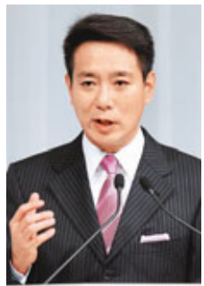
■日本《讀賣新聞》/共同社

與石昨日表示，民主黨兩院議員大會周五將敲定高層人事安排，預料最快下月1日改組內閣。