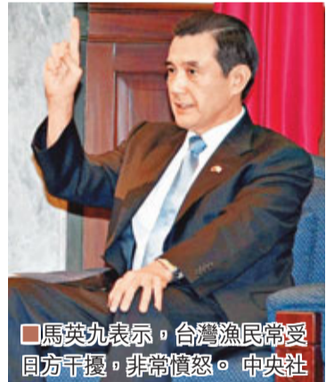
馬英九表示，台灣漁民常受日方干擾，非常憤怒。中央社

香港文匯報訊 據中通社報道，台灣領導人馬英九昨日上午接見外賓時指出，台灣漁民長期以來都在釣魚島水域捕魚，有紀錄可查的已超過100年，可是現在漁民到那裡去捕魚，卻經常受到日本海上保安廳的干擾，這就讓台灣漁民非常憤怒。