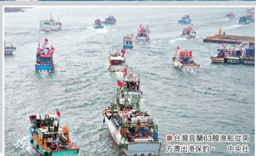
台灣宜蘭63艘漁船從南方澳出港保釣。中央社

香港文匯報訊(記者 軼璋 北京報導)日本強行將釣魚島「國有化」，不斷挑起事端，激起兩岸同胞無比憤慨。台灣漁民昨日展開歷年來最大型的保釣護漁活動，約100艘台灣漁船昨午啟航，打算開進距釣魚島12海里內的領海宣示「釣魚島主權，不容侵佔」，台灣當局派出10艘海巡艦護漁，軍方則海空備援；而中國大陸負責執行東海維權巡航執法的3艘海監船和1艘漁政船於昨日再次在釣魚島領海內開展例行維權巡航。日本外務省亞大局長杉山晉輔則向中國駐日公使韓志強「表達抗議」。