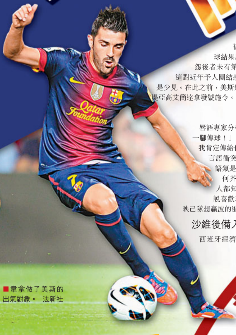
■韋拿拿了美斯的出氣對象。