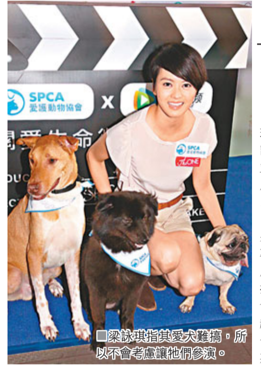
梁詠琪指其愛犬難搞，所以不會考慮讓牠們參演。