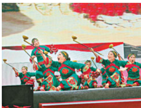
吉林省農民藝術家表演《關東老劇》。

香港文匯報訊（記者 況瑞、李兵 四川達州報導）由中國文聯、四川省政府主辦，達州市委、市政府等承辦的「第二屆全國新農村文化藝術展演」日前在四川省達州大竹隆重開幕。來自全國31個省（市、自治區）和達州本土的900多名農民藝術家同台獻藝，共同奏響「和諧大舞台，幸福新農村」的交響樂。