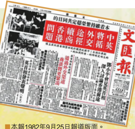
本報1982年9月25日報道版面。

香港地區包括香港、九龍和新界，它們分別在上世紀簽訂的《中英南京條約》、《中英北京條約》和《中英展拓香港界址專條》中，被割讓或租借給英國。