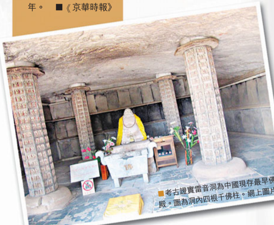
考古證實雷音洞為中國現存最早佛殿。圖為洞內四根千佛柱。

石經山雷音洞內的四根千佛柱，共雕刻佛像1,056尊，雕工精美。遺跡顯示，雷音洞的經板和四根千佛柱都是