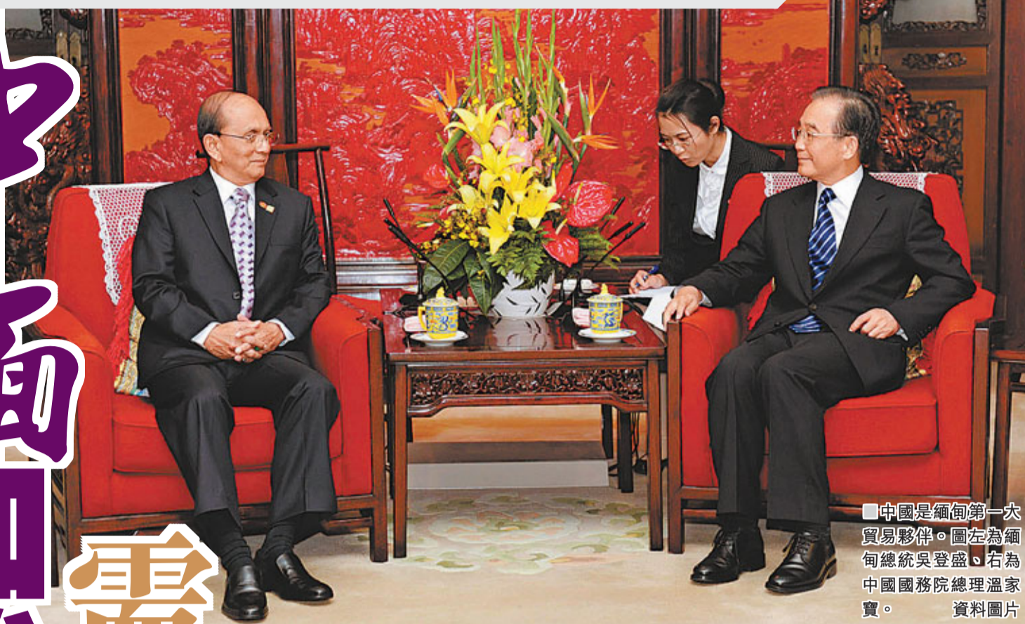
■ 中國是緬甸第一大貿易夥伴。圖左為緬甸總統吳登盛，右為中國國務院總理溫家寶。