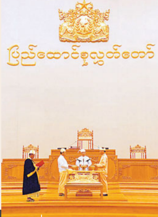
■ 吳登盛當選緬甸總統後，逐步放寬對政治及經濟上的監控。圖為吳登盛、當選副總統吳丁昂敏烏和吳茂康博士宣誓就職。

因此，中國政府及投資者日後在緬甸擴大經貿投資，不能只和緬甸政府交往，還要主動與當地居民、民意代表及非政府組織保持聯繫，確保中國經貿投資不會對當地居民產生負面影響之餘，讓他們分享箇中成果，才能確保中國在緬甸經濟上的領先優勢。