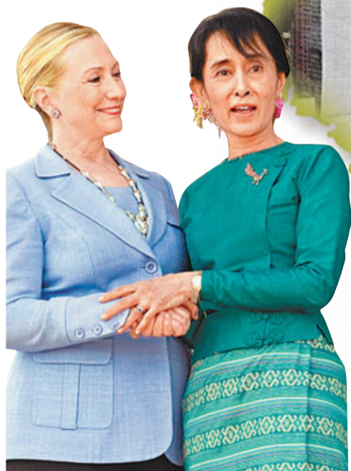
■ 昂山素姬(右)強調緬甸與美國改善關係，並不代表緬甸與中國的關係會倒退。左為美國國務卿希拉里。

基於緬甸的戰略意義，中國在緬甸投資興建大量與運輸及能源相關的基礎建設。例如，中國投資瀕臨印度洋東岸的實兌港擴建工程；興建由雲南至孟加拉灣的公路；興建由瀕臨印度洋東岸若開邦到雲南的輸油管，令中國可以繞過由美國及其盟友控制的馬六甲海峽，把石油從阿拉伯地區輸送到中國。