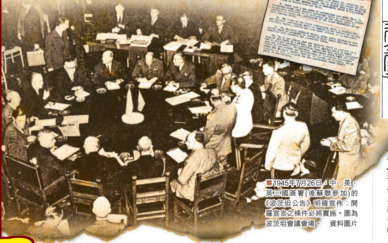
1945年7月26日，中、美、英三國簽署(後蘇聯參加)的《波茨坦公告》明確宣佈：開羅宣言之條件必將實施。圖為波茨坦會議會場。