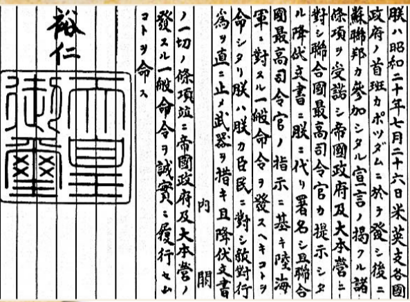
《日本投降書》。