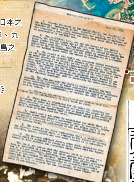
《波茨坦公告》。