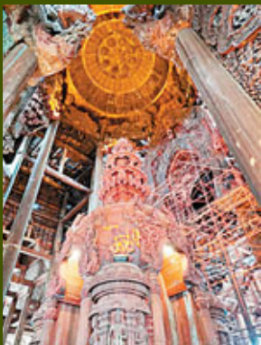
■整座城堡最先建造的是位於正中的Central Hall。