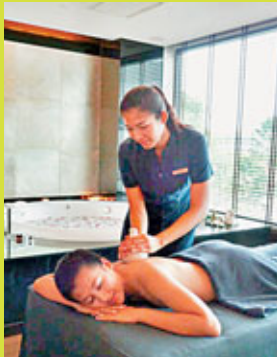
■在酒店內做Spa，以中等價錢享受酒店服務。