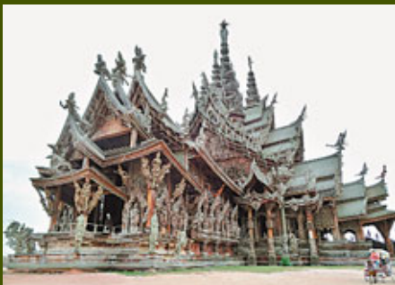
■建築恢宏的「真諦聖域」沒有門，四周都是通風的。