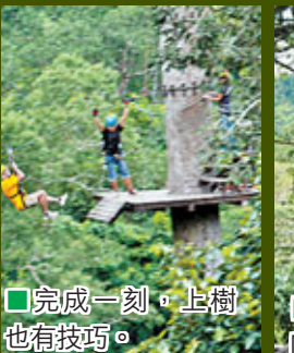
■完成一刻，上樹也有技巧。