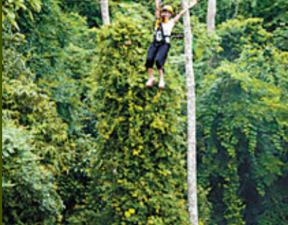
■滑索探險之旅由3299泰銖起，包教練、裝備和午餐。