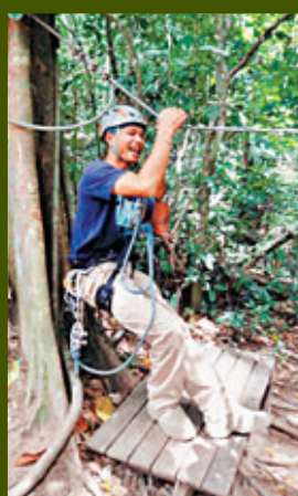
■教練在起飛前，講解各項安全措施。