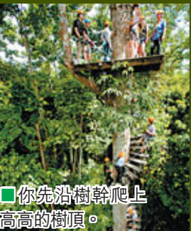
■你先沿樹幹爬上高高的樹頂。

者要想清楚才起行。起飛前，工作人員先替大家戴上頭盔、緊扣繩索，然後由隨行的專業教練講解滑翔期間和著陸時要注意的地方，之後步入森林，準備起飛。筆者第一次起飛時，不敢放手，更有點腳軟，但上去了，就必須勇敢滑過去，雙手牢牢捉緊固定器，雙眼一直向前看，不敢向下望。當第一次完成後，驚覺原來不是那麼可怕，還覺得很好玩，至第二次起飛時，心情已輕鬆起來，因為在高空看四周的風景實在很美，而且畢竟在香港難以得