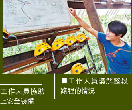
■工作人員講解整段路程的情況