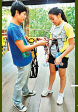
■工作人員協助穿上安全裝備