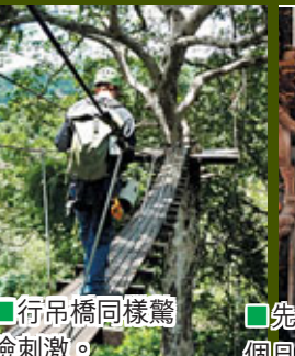
■行吊橋同樣驚險刺激。