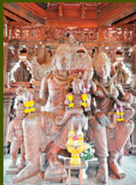
■Eastern Hall的雕像代表了父母偉大的愛。