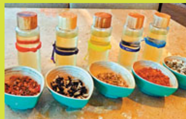
■心情治愈療程，有五種選擇。

進行過刺激的滑索探險後，身體有點疲累，回到Amari Orchid Pattaya酒店便嘗試了全新水療品牌Breeze Spa的療程。當中首推新穎、簡約的「心情治愈療程」(60分鐘1400泰銖起)，分為5種Mood，每一項療程都以傳統物理療法或按摩技巧為主調，並配以特製芳香精油、花草香茗、特選音樂及色彩心理學的應用，營造出愉悅、真切的感覺。今次筆者選擇了淋巴排毒的療程，與內地的有點不同，在使用精油前，會用刷子在肌膚上輕輕一掃，目的是喚醒肌膚，然後使用精油在穴位上按摩，力度很適中，不會感覺疼痛，全程在舒緩狀態下完成。