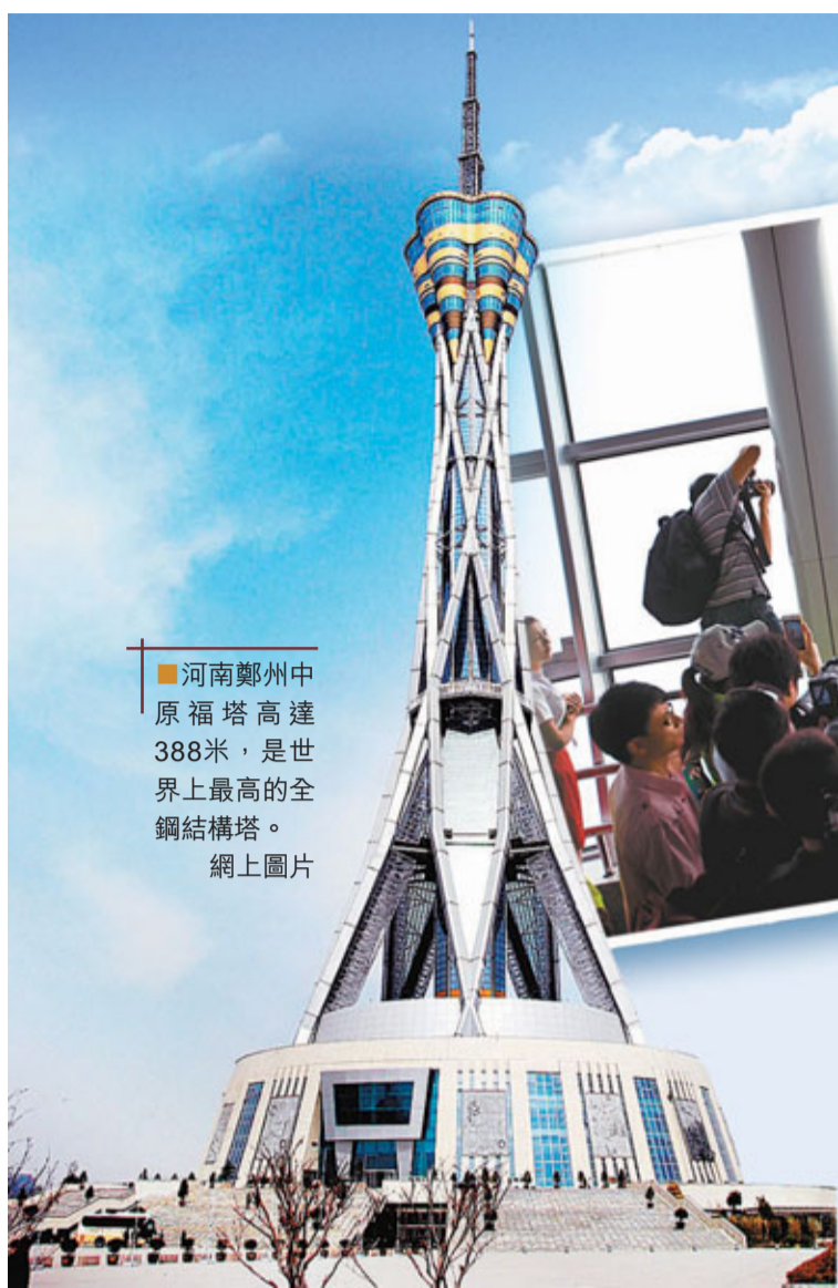
■河南鄭州中原福塔高達388米，是世界上最高的全鋼結構塔。

22日，世界知名的法國「蜘蛛俠」阿蘭·羅伯特成功挑戰世界上最高的全鋼結構塔——河南鄭州中原福塔。「出征」前，阿蘭依照中國人的習慣飲下一杯壯行酒：「這次的確是一次很大的挑戰，我也會有些許緊張，但我相信自己！」