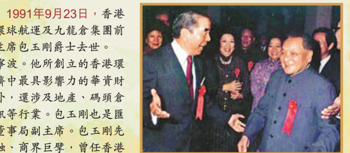
■已故國家領導人鄧小平曾15次會見包玉剛(圖左)，鄧曾言包是「中國人的驕傲」。

1991年9月23日，香港環球航運及九龍倉集團前主席包玉剛爵士去世。包玉剛生於1918年，祖籍浙江寧波。他所創立的香港環球航運及九龍倉集團，是香港經濟中最具影響力的華資財團之一。包玉剛家族除經營航運外，還涉及地產、碼頭倉儲、公共交通、酒店、零售、電訊等行業。包玉剛也是匯豐銀行第一位華人董事，並擔任董事局副主席。包玉剛先生是世界知名船東之一，香港金融、商界巨擘，曾任香港特別行政區基本法起草委員會副主任委員。包玉剛積極關心中國的四化建設，曾向內地捐建寧波大學等多項設施。