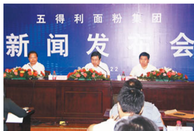
五得利麵粉集團有限公司22日召開新聞發布會對「硼砂事件」闢謠。

據中新社22日電 總部位於河北省邯鄲市大名縣的中國內地最大的麵粉生產企業五得利麵粉集團有限公司，22日在邯鄲市召開新聞發布會回應「硼砂事件」稱，該集團全線產品沒有添加國家禁止的硼砂，質監部門對該集團麵粉樣品的最新抽查亦沒有檢出致癌硼砂，目前集團所屬公司保持正常的生產和銷售。