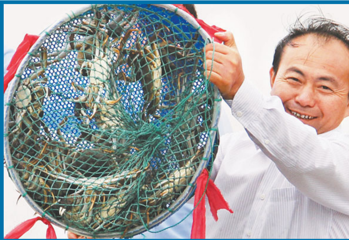
昨日在蘇州陽澄湖，一名蟹農在展示他剛剛捕到的大閘蟹。

從蘇州陽澄湖行業協會獲悉，今年陽澄湖大閘蟹的養殖面積與去年持平，產量則為2,500噸左右，比去年略有上漲。由於人工、餌料等方面的投入增多，今年的成本估計上漲5%到10%。但由於外地蟹集中上市，蟹商們的定價基本和去年持平。