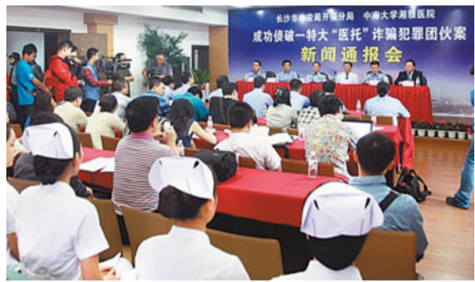
長沙市公安局22日舉行新聞發布會，披露「醫托」案的細節。

病人通常都是用幾千甚至上萬元錢購買到一堆所謂的「特效藥」，等到回家用藥一段時間後發現所謂的「特效藥」不過是