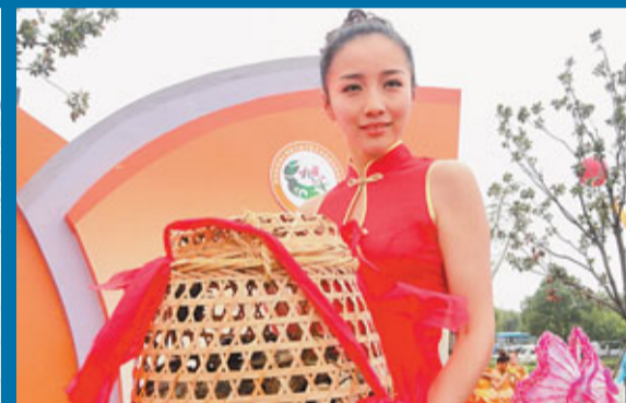
在蘇州陽澄湖大閘蟹開捕儀式現場，一名禮儀小姐展示新鮮的大閘蟹。