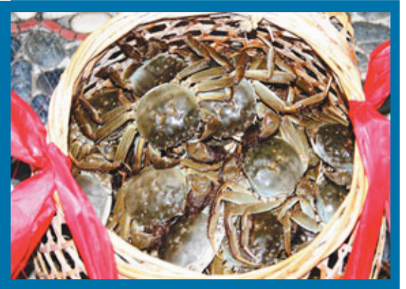
開捕儀式上的第一隻陽澄湖大閘蟹。