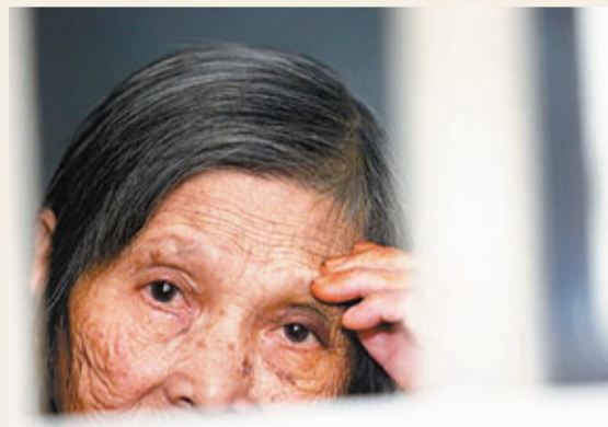
■農民外出務工增多，中國農村老年人「空巢家庭」比例也達到38.3%。網上圖片

香港文匯報訊(記者 劉坤領 北京報道) 中國老齡化進程加速，「空巢家庭」增多。全國老齡工作委員會辦公室副主任閻青春日前接受新華社採訪時透露，中國城市老年人「空巢家庭」比例已高達49.7%，專家預計，到2013年底，中國老年人口總數將超過2億。探索多種模式的養老服務呵護「銀髮族」安享晚年迫在眉睫。