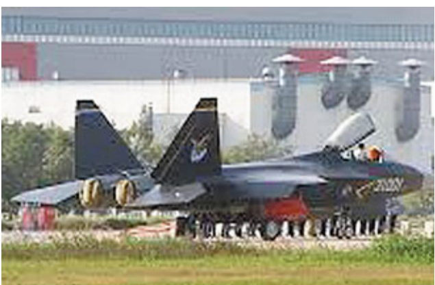
■最近，網際上傳了疑為「粽子機」殲-21真身的圖片。網上圖片

中國在隱形戰機領域的快速發展出乎外界意料。「俄羅斯之聲」20日引用俄空軍專家瓦西里·卡申的話說，如果殲-21確實存在，中國將是世界上唯一能同時實施兩個第五代戰機研製計劃的國家。他表示，美國和俄羅斯都無法承擔類似的龐大計劃，而歐盟甚至還未能決定是否研製第五代戰機。