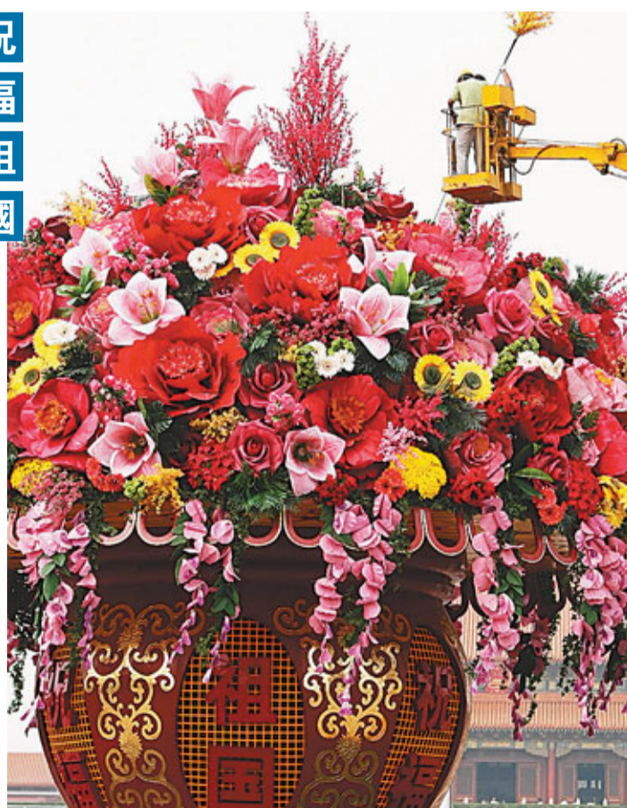
■北京天安門廣場國慶大花籃的主體部分昨日首次亮相。花籃主體以紅色為主色調，體現喜慶祝福之意。花籃加上底座高達15米，最寬處11米，目前已經完成主體部分的安裝，它是迄今為止天安門廣場布置過的最大花籃。它將與下方的如意圖案結合在一起形成直徑達50米，題為「祝福祖國」的立體花壇，在天安門廣場擺放至中共「十八大」開幕。