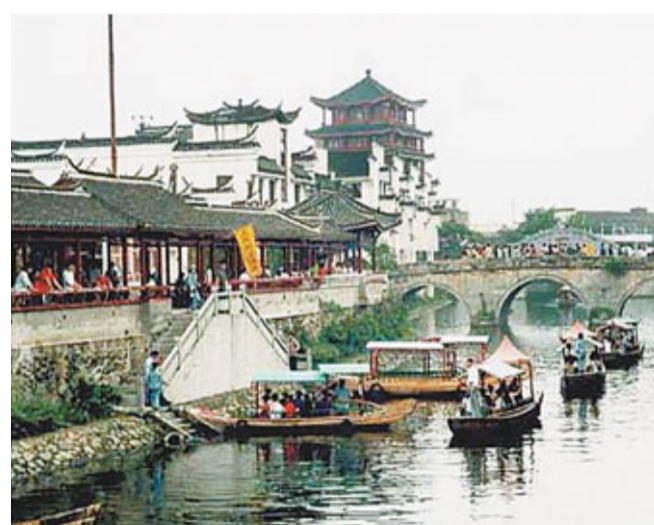
■合肥三河具有典型的「小橋流水人家，水鄉古鎮特色」。素有「遊在黃山，食在三河」之譽。

香港文匯報訊 中國公共經濟研究會和國家行政學院經濟學部19日聯合進行了「中國幸福城市評價體系課題」和中國幸福城市排名的發佈。在全國33個大城市幸福排名中，合肥、太原和廣州名列前三，北京、上海分列第五、第六位。