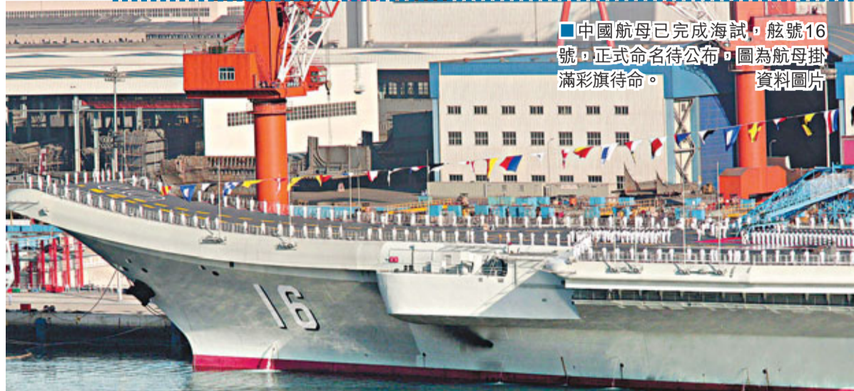
■中國航母已完成海試，舷號16號，正式命名待公布。圖為航母掛滿彩旗待命。資料圖片