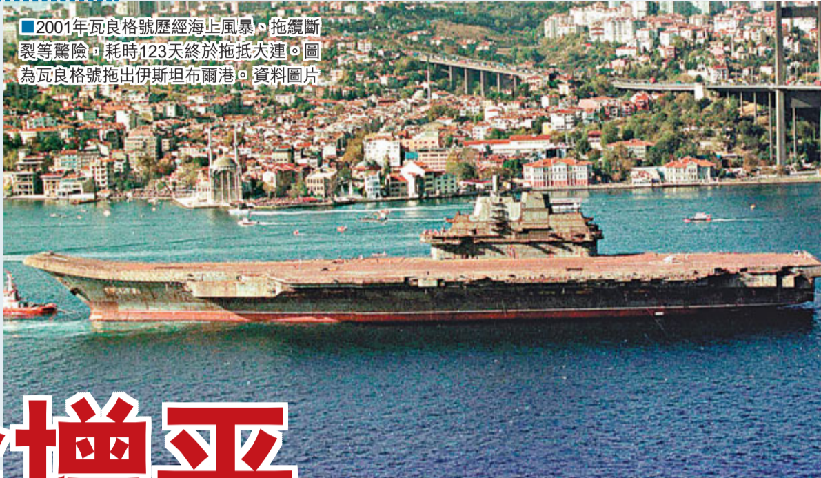
■2001年瓦良格號歷經海上風暴，拖纜斷裂等驚險，耗時123天終於拖抵大連。圖為瓦良格號拖出伊斯坦布爾港。資料圖片