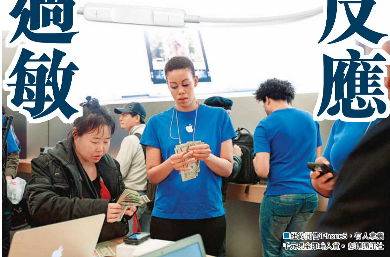
紐約開售iPhone5,有人拿幾千元現金即時入貨。

黑莓故障 歐非用戶當災 歐洲和非洲的黑莓智能手機服務前日故障近3小時,恰逢蘋果iPhone5在世界多個地方開售,令黑莓手機生產商Research In Motion(RIM)甚感尷尬,其行政總裁隨即就事件致歉。 黑莓前日先在社交網站facebook及微博twitter發文,表示系統出現故障,其後再稱已解決問題。 RIM行政總裁海因斯表示,受事件影響的歐洲及非洲用戶人數,佔整體客戶6%,公司正調查事件。他稱:「黑莓服務已恢復正常,沒有數據或訊息遺失。初步調查顯示,用戶傳送及接收訊息時,或有3小時延誤。」 美國投資銀行保富瑞的分析員稱:「黑莓將於明年年初推出新款智能手機,這事件在不適當的時候發生,或會損害公司名譽。」 ■美聯社