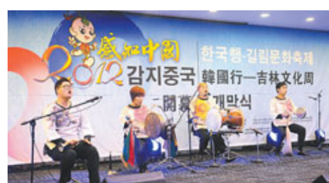
「2012感知中國行—吉林文化周」的樂隊表演。

近年來，吉林充分發揮在東北亞區域格局中的地緣優勢和中心輻射作用，緊密和強化東北亞區域各國間的文化藝術交流、合作與