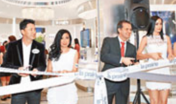
王敏德(前圖左)及名模Lisa S前日出席瑞士護膚品牌La Prairie的新店開幕儀式，為新店剪綵與品牌高層祝酒。王敏德其後又親身感受品牌舒適奢華的護膚體驗，令他開心大嘆享受。

香港文匯報訊 王敏德(前圖左)及名模Lisa S前日出席瑞士護膚品牌La Prairie的新店開幕儀式，為新店剪綵與品牌高層祝酒。王敏德其後又親身感受品牌舒適奢華的護膚體驗，令他開心大嘆享受。