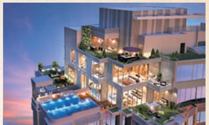
■全屋落地大玻璃設計的「瓏門天池屋」居高臨下，享空中私人泳池，顯赫罕有。

瓏門各方面的優勢無兩，而整個建築的焦點更必落在獨一無二的特色單位「瓏門天池屋」上。位於第一座47樓，複式連天台，五房三套房連工人房間，總建築面積逾2500平方呎的「瓏門天池屋」，全屋落地大玻璃設計，居高臨下視野遼闊無阻，矜罕打造長逾20呎空中私人泳池、4個平台及1個天台，廣闊的獨立室外空間，可用作健身運動或燒烤聚會，私隱度極高，如此奢華閒逸，同區難求。