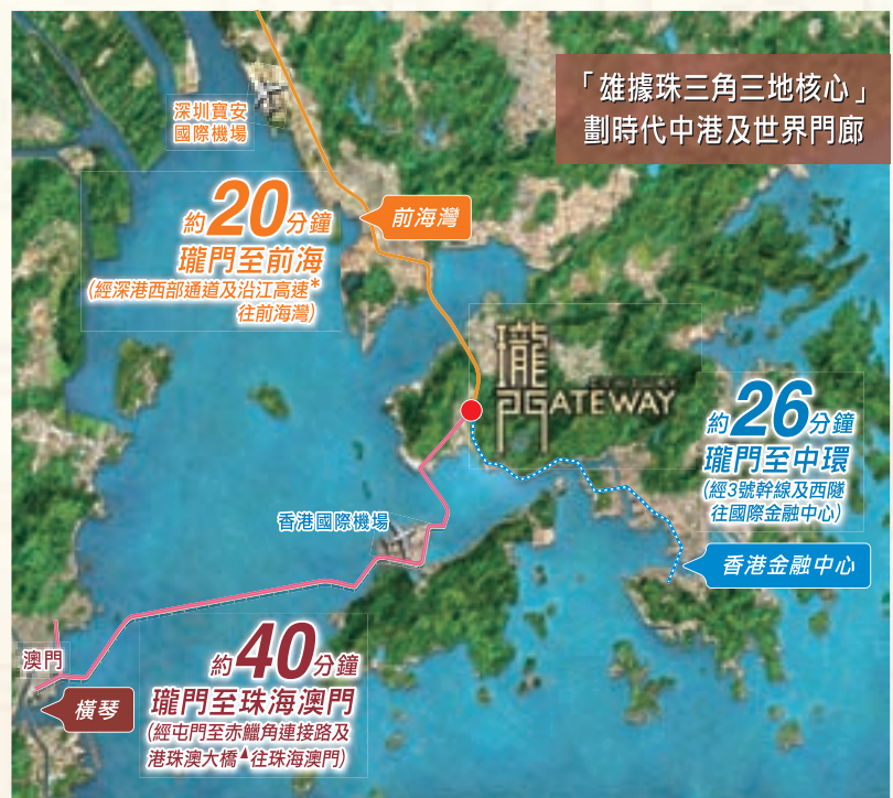
■位處港珠澳交通網絡中心，盡享地利優勢。

國家「十二五」規劃計劃斥鉅資發展珠三角，港珠澳大橋*及屯門至赤鱗角連接路*落成後，三大CBD的距離將會大大拉近，加上珠海橫琴將發展為珠三角物流及旅遊文化創意中心，以及政府正研究將屯門規劃為全新的高增值物流中心，屯門作為三大CBD之核心，在珠三角所扮演的角色將與日俱增。